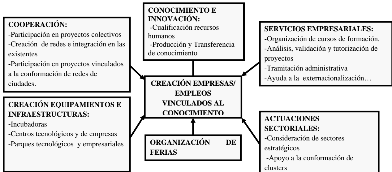
Figura 2. Estrategias públicas para la promoción de la economía del conocimiento en la aglomeración metropolitana de Sevilla

Resulta especialmente interesante la capacidad mostrada por las instituciones públicas para desarrollar formas de cooperación a partir de proyectos colectivos que favorezcan la puesta en valor de los recursos asociados al conocimiento, pues, como señalan entre otros Romero y Farinós (2011), no puede olvidarse que las redes de cooperación están estrechamente relacionadas con la gobernanza y ésta con el desarrollo territorial.