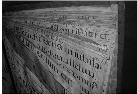
Foto 1. Mutilaciones de textos, en una reencuadernación. Abadía del Sacromonte de Granada (libro 370).

Sin embargo, las principales alteraciones son causa directa de la falta de uso y el abandono de estas obras tan particulares (acumulación de suciedad, mutilaciones, pérdidas parciales o totales tanto de la información como de los propios volúmenes, etc.).