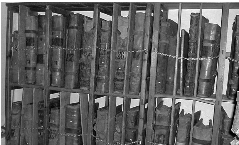
Foto 8. Almacenamiento vertical en estantes de madera de libros de coro.

(especialmente en la esquina inferior por ser la zona por donde se pasan habitualmente las hojas), refuerzo con charnelas de los cuadernillos, parchado de hojas (con papeles blancos y manuscritos, telas y/o pergaminos), aplicación de adhesivos orgánicos (de cola animal o engrudos de harina) y cosido de roturas en forma de raspa de pescado (incluso existen originalmente cuando el libro es de menor calidad).