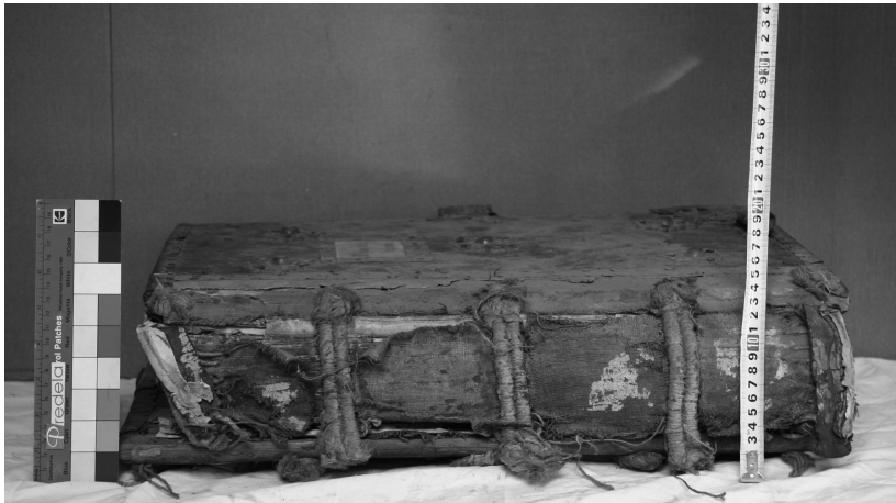
Foto 2. Cosido original de un cantoral con tres nervios de cuerdas de cáñamo dobles. Iglesia de San Justo y Pastor de Granada.

La encuadernación de un cantoral comenzaba con la unión de dos pieles transformadas en hojas de pergamino, o de una hoja de papel doble, en lo que se denomina biniones o bifolios, que se pautaban para marcar las zonas en las que se ejecutaban los textos e ilustraciones. Con la agrupación de biniones, generalmente de cuatro en cuatro, se confeccionaban los cuadernillos que eran ordenados y cosidos entre sí para componer el cuerpo del libro, con dos, tres o cuatro nervios de tiras cuero o gruesas cuerdas (foto 2).