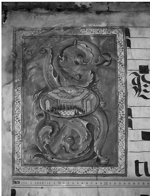
Foto 7. Detalle de la oxidación del oro falso (esquina superior izquierda de la miniatura), pudrición y oxidación de metales (en los bordes) y corrimiento de tintas por exceso de humedad (libro 305). Abadía del Sacromonte de Granada.

Otro factor de deterioro son las estanterías, las originales son de madera y no es extraño que tengan ataque de xilófagos; en el mejor de los casos, se han sustituido por estantes metálicos para su acondicionamiento individual 14 . Los cantorales, se almacenan verticalmente y por su gran tamaño y peso presentan casi en su totalidad los lomos desgarrados por la cabeza y pie, al tirarse de estas zonas para sacarlos y meterlos; sobre todo cuando se les rompen las tiras que, para este fin, se solían colocar en el lomo (foto 8).