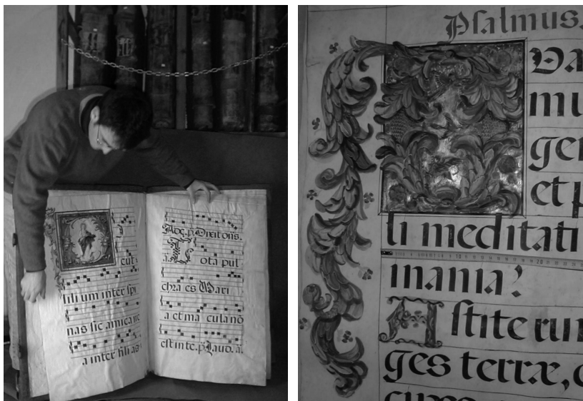
Foto 3 (izquierda). Tamaño medio de un libro de coro (libro 373). Abadía del Sacromonte de Granada. Foto 4 (derecha). Tamaño de una inicial y de las letras de un cantoral (libro 338). Abadía del Sacromonte de Granada.

taba, o cuando alguna era clausurada 4 , o por donaciones o regalos 5 . Lógicamente las instituciones de mayor peso poseían colecciones más numerosas de este tipo de libros, con ejemplares generalmente de mayor calidad artística, por ejemplo en la Catedral de Sevilla hubo más de 200 ejemplares; sin embargo hoy es frecuente que, debiéndonos encontrar colecciones centenarias, aparezcan apenas algunos ejemplares en muchos casos mutilados ya sea en sus contenidos como en sus encuadernaciones 6 .