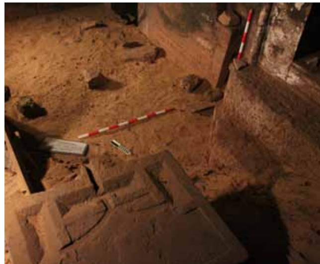
Figura 4. Mesa de ofrendas de Reino Medio

que las anteriores. Ninguna de ellas presenta inscripciones, sólo el signo Htp. Hasta el momento puede decirse que la presencia de estas mesas de ofrendas en esta parte de la tumba responde a la cercanía del nicho, el área más sagrada de la tumba. Es posible que al menos una de las mesas de ofrendas pueda datarse en Reino Medio 4 , lo que indica que fue reutilizada durante la Dinastía XVIII o el Periodo Tardío.