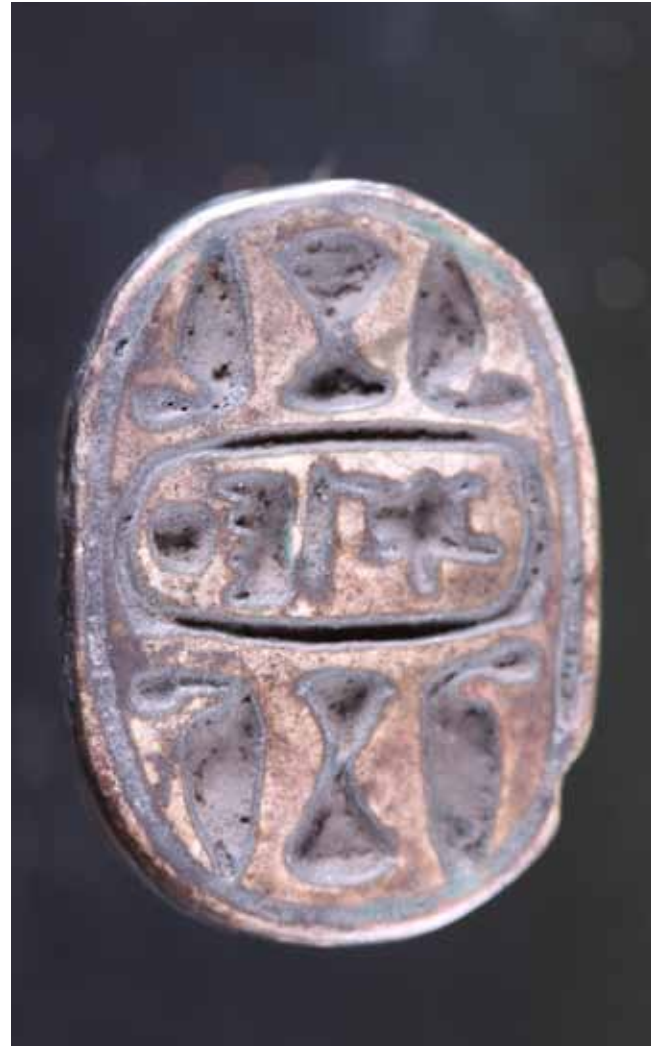
Figura 3. Escarabeo con mención del nombre de Tutmosis III

c) Madera: aunque la mayoría de fragmentos de madera están muy afectados por el fuego, se conservan algunas policromías. La mayoría podrían pertenecer a ataúdes, cajas y estatuas Ptah-Sokar-Osiris. Aunque ninguna de estas últimas ha sido descubierta completa, sí se han documentado fragmentos: cuer-