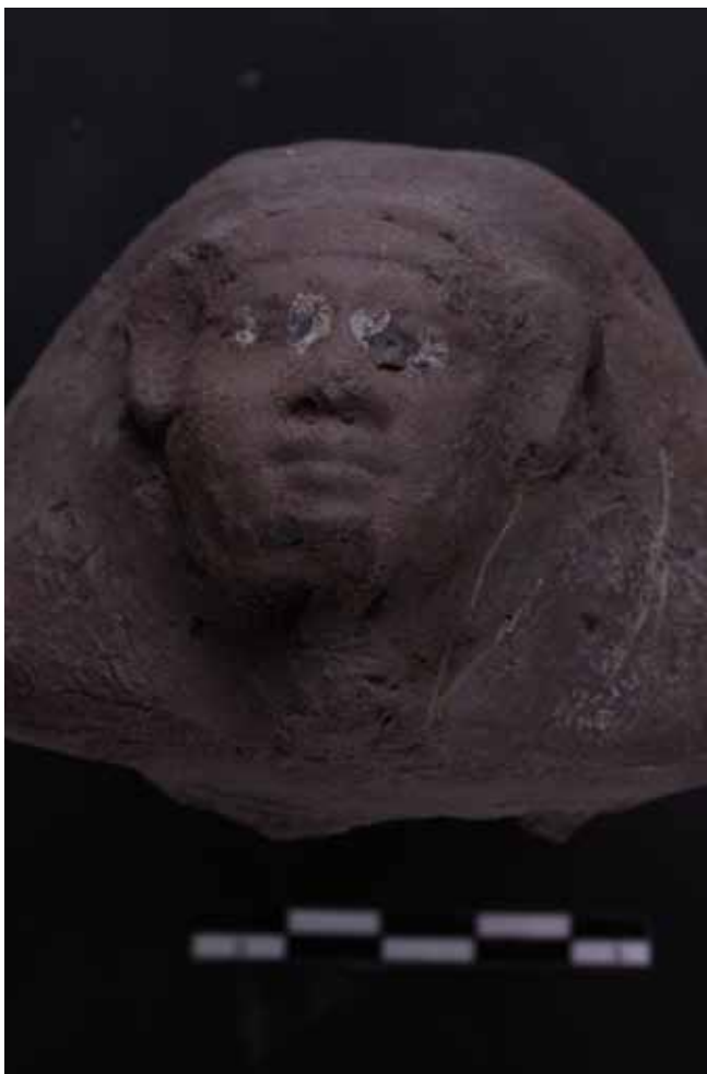
Figura 6. Tapa de un vaso canopo del Reino Nuevo