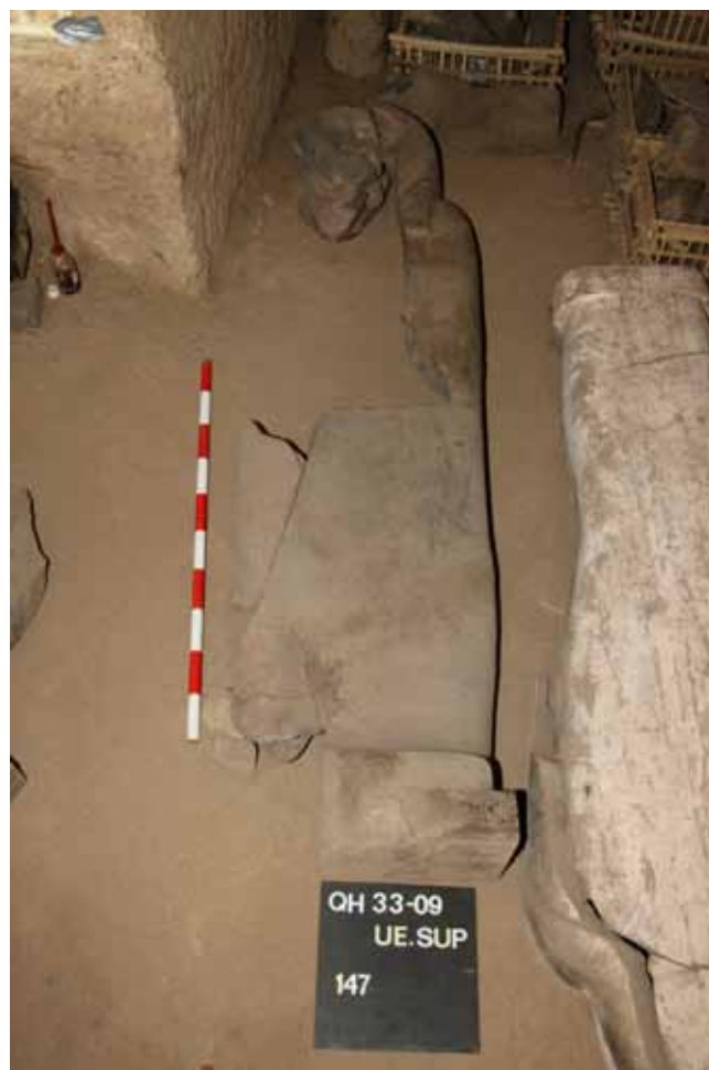
Figura 7. Uno de los sarcófagos de piedra hallado en la QH33

La datación de estos sarcófagos puede estar conectada con la presencia de cerámica de Época Tardía (Dinastías XXVI-XXVII), ya que en periodos precedentes de ocupación (Dinastías XII-XVIII) no se producían este tipo de sarcófagos.