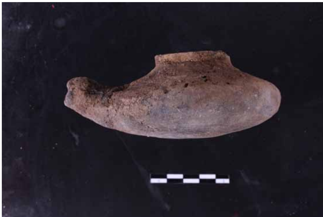
Figura 5. Lámpara "Aladín"