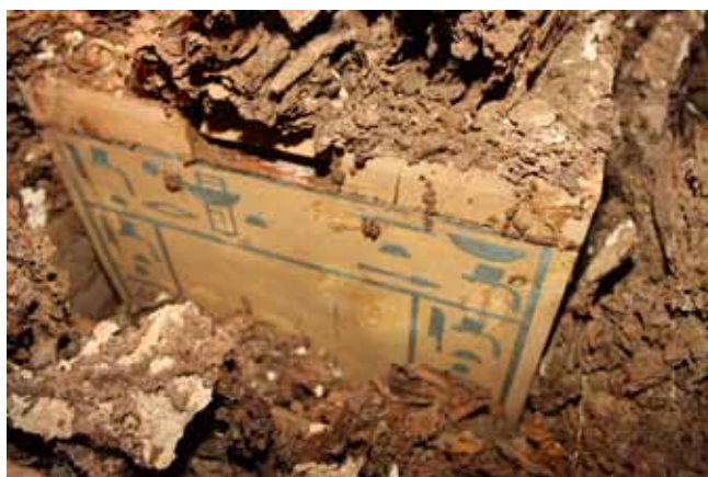
Figura 2. Nueva cámara intacta de la XII Dinastía

Las dos fases siguientes de ocupación de la tumba datan de periodos posteriores, concretamente del reinado de Thutmosis III y de Época Tardía. En ambos