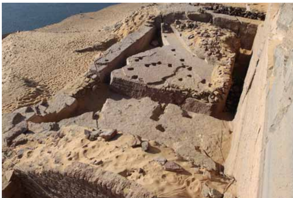
Figura 1. Exterior de QH33 tras la campaña 2010