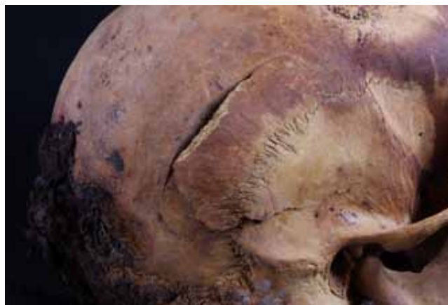
Figura 8. Lesiones inciso contusas en el cráneo de un adulto joven

La intervención en la tumba de Khunes puede considerarse un trabajo de urgencia. El estado de conser-