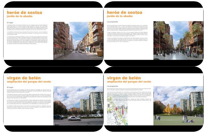
Estado inicial comparado con las propuestas para discutir colectivamente