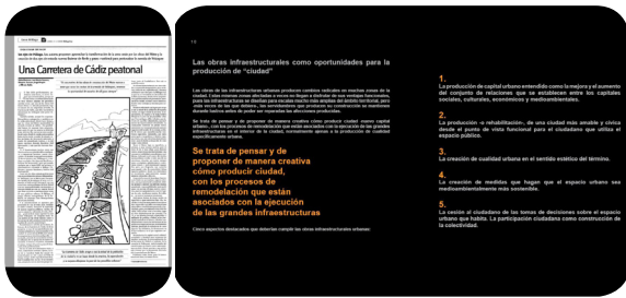
Propuesta realizada en MálagaHoy.