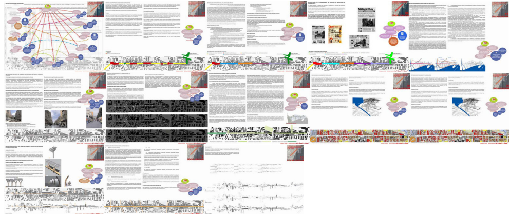
Metodología. // Sectores de proyecto // Participación en la planificación urbana // Transparencia del proceso // Accesibilidad y movilidad Tratamientos superficiales de calles y espacios urbanos // Alumbrado público // Vegetación // Aparcamientos // Planeamiento y Legislación Mobiliario urbano y producción de energía eléctrica fotovoltaica // Instalaciones urbanas // Soleamiento

es físico y virtual a la vez. La población relevante que habita el espacio está compuesta por agentes que son muy variados, desde los políticos y técnicos que piensan y proyectan el espacio, hasta los habitantes y usuarios que lo habitan y usan y (entre los que se pueden encontrar también habitantes no humanos).