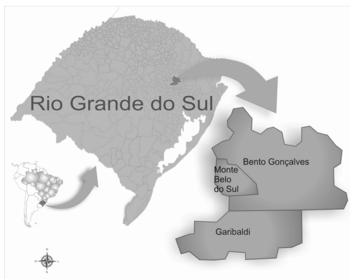
Figura 2 - Mapa Ilustrativo de los Municipios que forman parte del "Vale dos Vinhedos", Rio Grande do Sul, Brasil.

cuentran precisamente asociadas al florecimiento de esta "agricultura colonial" 23 y al proceso de acumulación de capital allí resultante, un fenómeno en el que tuvo una importancia decisiva el conocimiento técnico de los inmigrantes. A ello habría que añadir la intensa articulación que se fue desarrollando en esa zona entre ciertas ramas de actividad industrial (metalurgias, textiles, calzados, vinos, etc.) y las estrategias seguidas por las familias rurales para garantizar su reproducción, dando a la dinámica social y económica de estos territorios un rasgo diferencia-