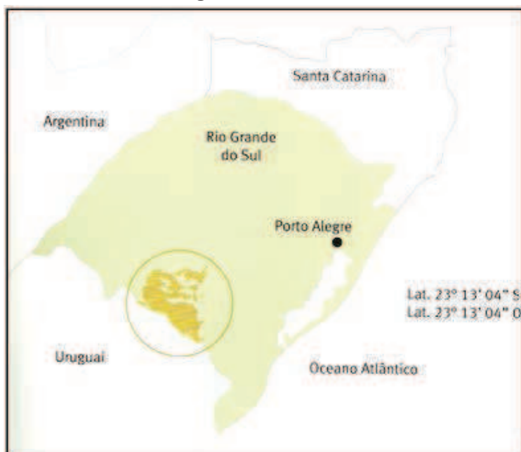
Figura 2.: Delimitación del área de la IPPGCM

La IPPGCM fue concedida a estos ganaderos, a su asociación APROPPAMPA, en 2006.