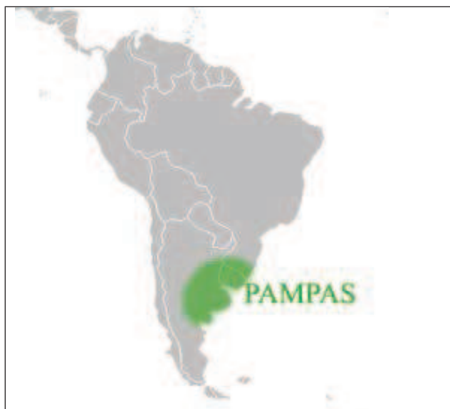
Figura 3.: En color verde el territorio ocupado por Las Pampas , en el sur de Brasil, Uruguay y Argentina