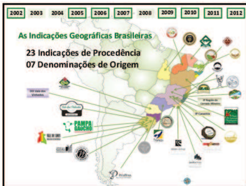
Figura 1.: Evolución de las Indicaciones Geográficas en Brasil, de 2002 a 2012

El cuadro siguiente nos habla del vertiginoso crecimiento de las IGs en Brasil, las cuáles se han multiplicado en estos dos últimos años.