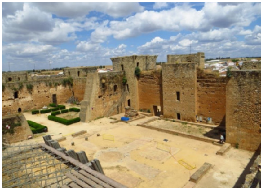
Figura 5. Castillo de Niebla, patio de armas. Obsérvese el añadido de otro medio recinto.