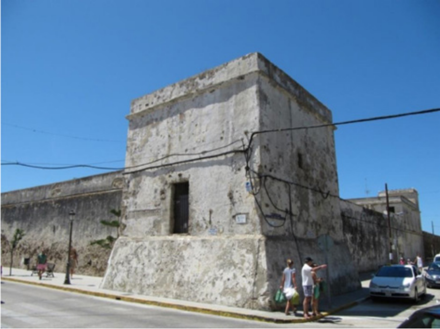
Figura 10. Fortaleza y casa-chanca de Zahara de los Atunes.