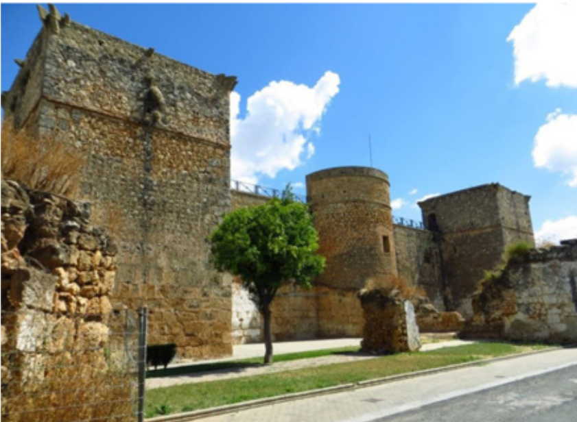
Figura 4. Castillo de Niebla, década de 1480-1492.