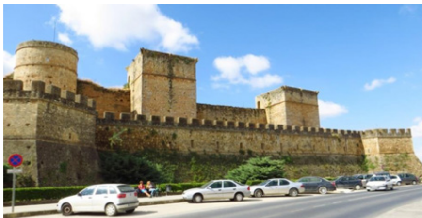
Figura 6. Castillo de Niebla, falsabraga artillada en alambor (realizada en tiempos de la condesa Doña Leonor, 1564-65).