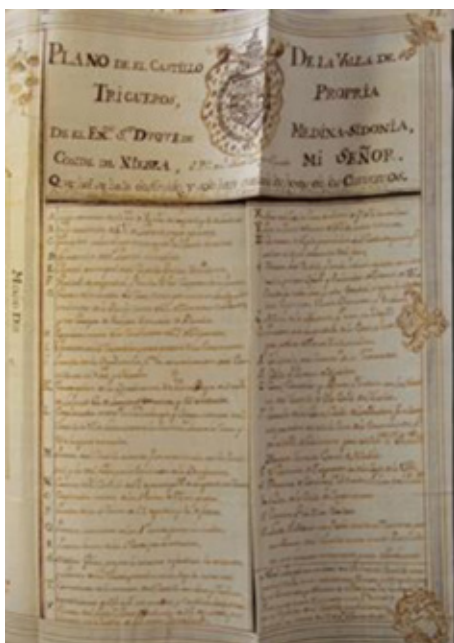
Figura 9 a y b. Castillo de Trigueros, plano realizado en julio de 1768 por Joaquín Pérez.