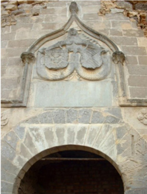
Figura 3. Castillo de Santiago de Sanlúcar de Barrameda, Puerta de la Sirena (labrada por Marinus de Neapoli).