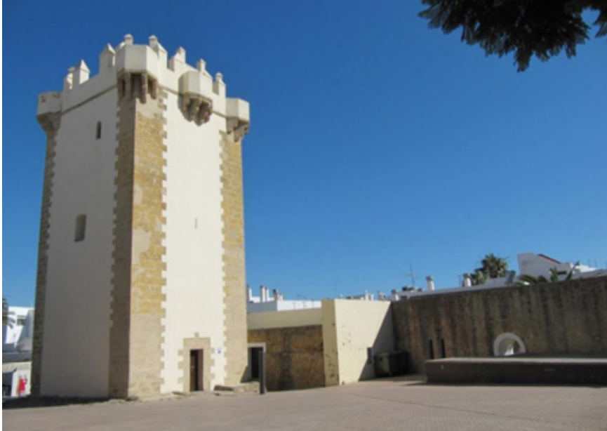
Figura 7. Torre de Guzmán, en el castillo de Conil de la Frontera, de fines del XIII con reformas posteriores.