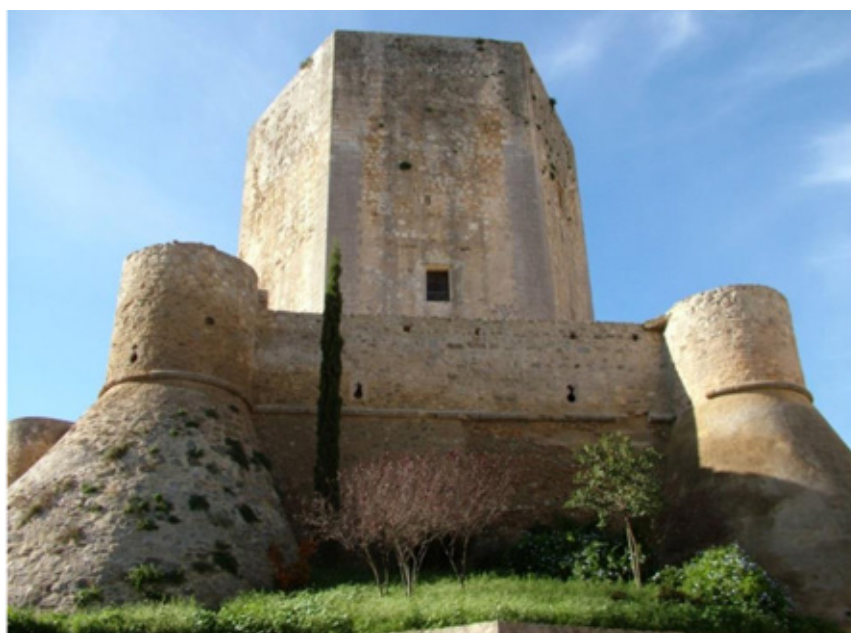
Figura 2. Castillo de Santiago de Sanlúcar de Barrameda, Torre del Homenaje y falsabraga artillada en alambor (terminada por la condesa de Niebla doña Leonor Manrique de Sotomayor, 1559).