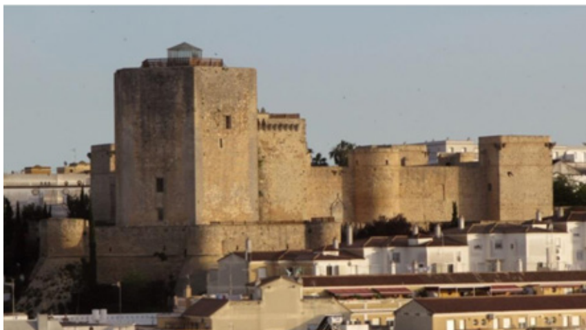
Figura 1. Castillo de Santiago de Sanlúcar de Barrameda, década de 1470 y principios de los 80.