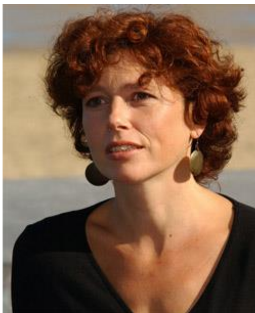
Iciar Bollaín Pérez Mínguez (Madrid 1967).

Debutó como actriz a los 15 años y el director de cine español Víctor Erice la escogió un año más tarde para protagonizar su primera película El sur . Después de esta interpretación, Iciar Bollaín protagonizó diferentes largometrajes, una serie televisiva Miguel de Servet La sangre y la ceniza y una ópera. Estudió en la Facultad de Bellas Artes de la Universidad Complutense de Madrid, pero abandonó los estudios para dedicarse al cine por completo.