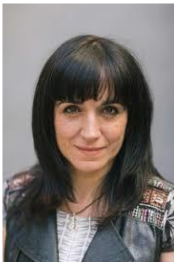
Judith Colell (Sant Cugat del Vallés Barcelona 1968)

Cursa su licenciatura en Historia del Arte, y tras finalizar sus estudios de cine en Nueva York, Ha trabajado como directora de teatro y guionista, debuta en 1992 con el cortometraje Clara Foc . Cuatro años más tarde rueda Escrito en la piel , candidato al Premio Goya como Mejor Cortometraje de Ficción.