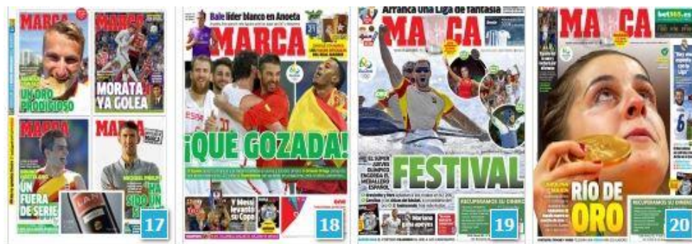
Fuente: Portadas polideportivas Marca 17-20 de agosto de 2016.

También queda para el recuerdo el famoso Jueves Olímpico donde conseguimos el oro en piragüismo de la mano de Craviotto y Toro en la modalidad de K2 200, así como el pase a finales de Carolina Marín (oro) en Bádmin-ton y las chicas de la selección española de baloncesto (plata), asegurando así la medalla, un motivo meramente basado en el resultado sin el cual no habrían aparecido en la primera página. Si esas portadas podían dar un vuelco hacia el pluralismo y hacia el tratamiento de otros deportes, el escenario ideal era durante la celebración de los JJOO, pero ni este evento trascendental pesa más para decantar la balanza informativa, pero observamos en la tabla que ese hecho no ocurrió.