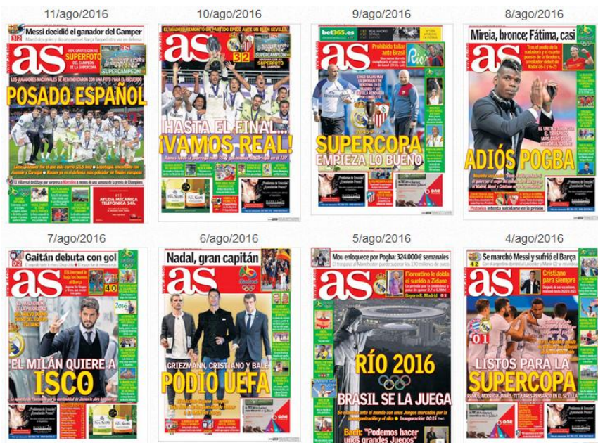
Fuente: Portadas diario As 4-11 de agosto de 2016.

Este recurso es usado habitualmente para fusionar en una portada dos o más deportes, algo que es inconcebible para el balompié, cuyas portadas son únicamente sobre este deporte, como vemos en la imagen inferior. Podemos afirmar que no hay pluralismo deportivo en el contenido de las portadas, veremos más adelante si hay cambios significativos en los contenidos del periódico.