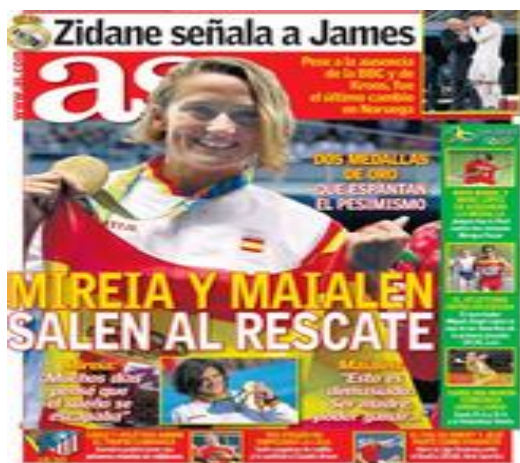
Fuente: Portada diario As 12 de agosto de 2016.

Este recurso es usado habitualmente para fusionar en una portada dos o más deportes, algo que es inconcebible para el balompié, cuyas portadas son únicamente sobre este deporte, como vemos en la imagen inferior. Podemos afirmar que no hay pluralismo deportivo en el contenido de las portadas, veremos más adelante si hay cambios significativos en los contenidos del periódico.