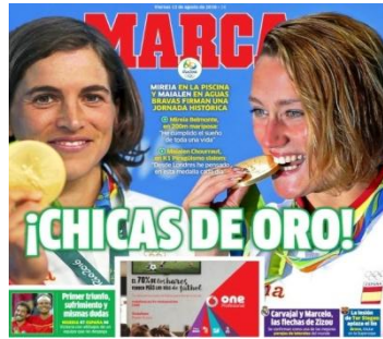
Fuente: Portada Marca 12 agosto de 2016.

También queda para el recuerdo el famoso Jueves Olímpico donde conseguimos el oro en piragüismo de la mano de Craviotto y Toro en la modalidad de K2 200, así como el pase a finales de Carolina Marín (oro) en Bádmin-ton y las chicas de la selección española de baloncesto (plata), asegurando así la medalla, un motivo meramente basado en el resultado sin el cual no habrían aparecido en la primera página. Si esas portadas podían dar un vuelco hacia el pluralismo y hacia el tratamiento de otros deportes, el escenario ideal era durante la celebración de los JJOO, pero ni este evento trascendental pesa más para decantar la balanza informativa, pero observamos en la tabla que ese hecho no ocurrió.