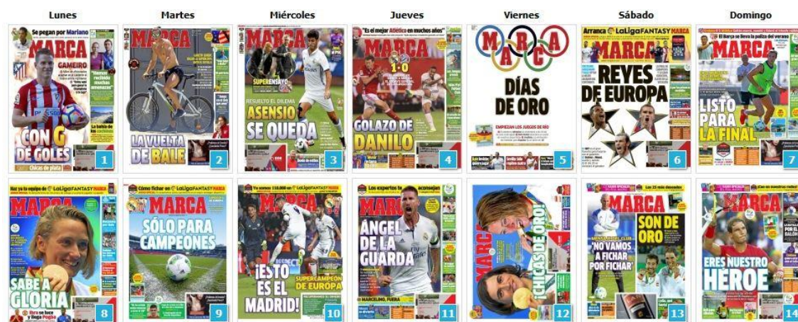
Fuente: Portadas diario Marca 1-14 de agosto de 2016.