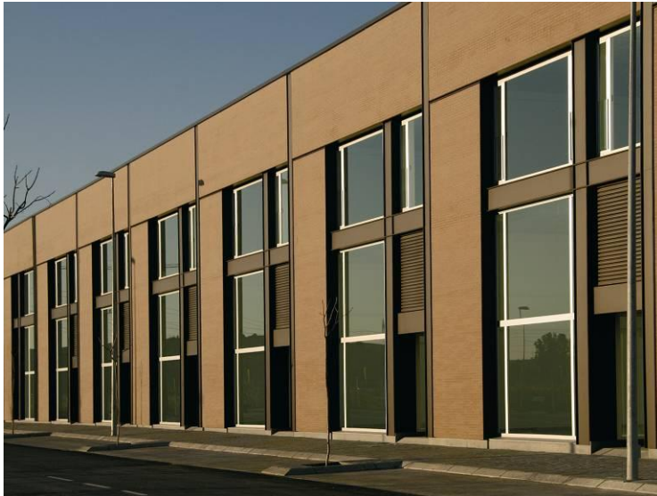
Fig.8. Fachada de las naves en CITEC. Autora : Charo Pérez.

En cuanto a la materialidad, se ha pretendido generar una imagen compacta y uniforme que sobreviva al impacto y griterío de la cartelería publicitaria. Inspirado en los complejos industriales alemanes de principios de siglos, se opta por el ladrillo como material de formato pequeño para compensar la sobreescala de las piezas. Además, se opta por abrir grandes huecos de vidrio de forma que la propia actividad, integrada con la arquitectura, también forme parte del paisaje a base de luces y sombras interiores.