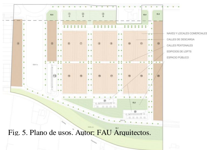
Fig. 5. Plano de usos. Autor: FAU Arquitectos.

Debido a la proximidad de las bolsas residenciales al parque industrial se plantea desde un primer momento establecer una serie de colchones a través de espacio público y arquitecturas de uso mixto que permitan el crecimiento alrededor de sus límites de una forma sensata que promueva el fomento de las relaciones. Por ello, los límites de CITEC los configuran o bien zonas de parque o edificios de lofts y oficinas.