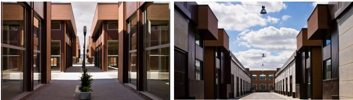
Fig. 6. Calle peatonal (izquierda) y calle interior de descarga (derecha) en CITEC.

Así mismo, para conciliar lo urbano y lo industrial, se diseña una estrategia en la cual lo doméstico pueda convivir con lo productivo y que viene dada a través de la integración de los usos. Para ello, y sin alterar los parámetros normativos, se aplica un pequeño ajuste consistente en eliminar el retranqueo en fachada de los edificios, y sumarle su superficie al retranqueo trasero, con lo que se consiguen dos cosas importantes; la primera es adecuar la calle a la escala humana, y mantener una relación lógica entre la edificación y el recorrido público, sin las vallas ni acopio de materiales entre la calle y la entrada a cualquier local. La segunda es que con la superficie sobrante se habilita una calle trasera de carga y descarga, que separa eficazmente el uso industrial del comercial, permitiendo que las fachadas principales y las calles que las sirven, estén libres de servidumbres de paso, de uso y de riesgo. Se consigue de este modo que ambos usos convivan en un mismo espacio sin alterar las cualidades del mismo para unos y otros usuarios.