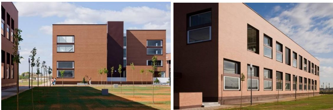
Fig. 7. Edificios de lofts en CITEC. Autor: Fernando Alda.

Como respuesta arquitectónica a la demanda de nuevos espacios que sirvan para algo más que el uso industrial, en CITEC, a parte de naves, se incorporan nuevos híbridos tipológicos a mitad de camino entre el uso administrativo y el doméstico, espacios que son capaces de acoger a multitud de sectores productivos. Estos edificios mixtos los constituyen por un lado los locales comerciales situados en las esquinas de las manzanas de naves a modo de cierre, y los edificios de lofts, por otro lado. Estos últimos están pensados para aquellos que adaptan su espacio de trabajo en el lugar de su vivienda, y que ahora pueden adaptar su vivienda al espacio de trabajo. De esta forma, la escala de los edificios se acomoda gradualmente, pero también su uso y sus flujos, desintegrando las fronteras entre el horario comercial y la muerte de la ciudad.