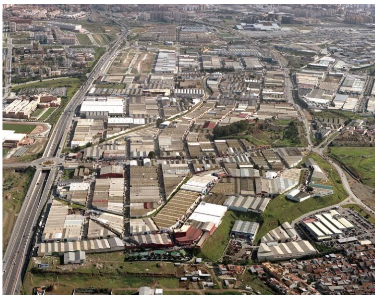
Fig 1. Polígono Industrial El Viso (Málaga). Autor desconocido.

Usos industriales que conviven con viviendas unifamiliares de autoconstrucción sobre terrenos de parcelación ilegal, infraestructuras descosidas dando servicio sólo a áreas concretas, terrenos rústicos tratados como urbanos, carteles y anuncios de gran formato que pugnan por un mayor eco dentro de un griterío insostenible, todos ellos son, entre otros, aspectos que caracterizan el paisaje de nuestros bordes urbanos creando una carta de presentación no muy apropiada para quienes se aproximan desde fuera.