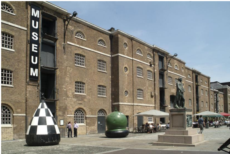
Fig. 3. Área de los Docklands en Londres (antiguos almacenes portuarios convertidos en equipamientos culturales y espacios públicos). Autor: Museum of London-Docklands.

Uno de los primeros Parques creados en el área metropolitana de Sevilla bajo el prisma del rápido desarrollo económico sin previsión fue el PISA, en Mairena del Aljarafe, cuyo éxito veloz provocó que todas las localidades crearan un modelo a su imagen y semejanza, sin reflexionar mínimamente sobre los elementos que, claramente, no funcionaban. Otro ejemplo paradigmático será el polígono industrial de Chinales en Córdoba, el cual, fagocitado por la propia ciudad sin ningún tipo de planificación y ordenación previa, permanecerá en el tejido urbano a modo de isla en la cual ni los espacios públicos ni la escala urbana son posibles.