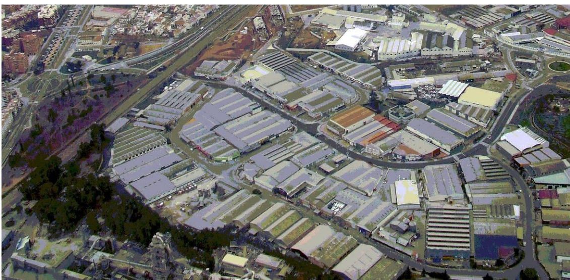
Fig 2. Vista Aérea del Polígono Industrial Chinales (Córdoba). Autor desconocido.

Ubicados originariamente al margen de la ciudad, para de alguna forma, gozar de los beneficios de una localización cercana que redujera la distancia al lugar de trabajo y el recorrido del transporte de los objetos manufacturados, los polígonos industriales surgieron como agrupaciones de pequeñas industrias con vocación de rentabilizar sus infraestructuras. Se trata, por tanto, de lugares de amplia escala preparados para el manejo de maquinarias y el transporte de mercancías y, no tanto, para la vida doméstica. Sin embargo, los procesos de crecimiento de la mancha urbana terminarían por fagocitar dichos polígonos industriales que, bajo la denominación de Parques Industriales o Empresariales, quedaron mal integrados en la trama, chirriando su escala, materiales y servidumbres de uso.