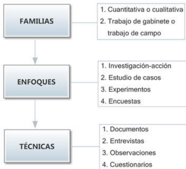
Figura 1. Niveles de concreción en el diseño metodológico de una investigación (según Blaxter, Hughes & Tight, 2005).

lidad de investigación de corte cuantitativo y basado en un trabajo de campo. Por extensión, se ha seguido un enfoque metodológico semiexperimental , según el cual se puede estudiar el efecto de materiales curriculares o métodos de enseñanza en varias clases o colegios que no están asignados de forma aleatoria. Sin embargo, «es posible administrar un tratamiento experimental a algunas de las clases y considerar a las otras como controles» (McMillan & Schumacher, 2005, p. 41). Y este es el caso que nos ocupa, al elegir el profesor-investigador a los alumnos del curso 2013-2014 para probar el efecto de la utilización de dispositivos móviles en la mejora interpretativa de los mismos (grupo experimental), comparando sus resultados con los alumnos que no utilizaron ningún tipo de tecnología (grupo control). Por último, entre las técnicas utilizadas para la recogida de datos