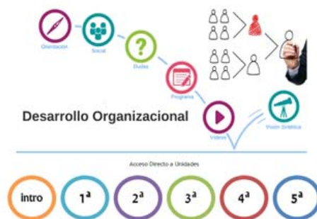
Figura 2. Elementos permanentes (elaboración propia)

La posibilidad de incrustar iconos propios, ha permitido el desarrollo de interfaces no estandarizadas, con una identidad alusiva a la temática u objetivo de aprendizaje que presenta el curso. Para tales fines se establecen criterios metafóricos de organización espacial de los recursos de aprendizaje de tal forma de potenciar