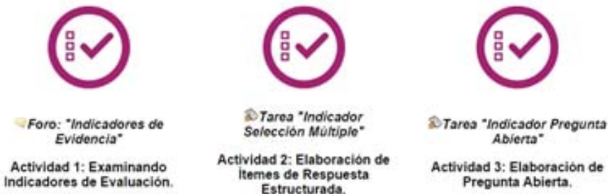
Figura 5. Listados de evaluaciones del módulo (elaboración propia).

A continuación podrá encontrar los instrumentos de evaluación relacionados a los productos de aprendizaje (formativos o sumativos) entregados en el módulo 3: