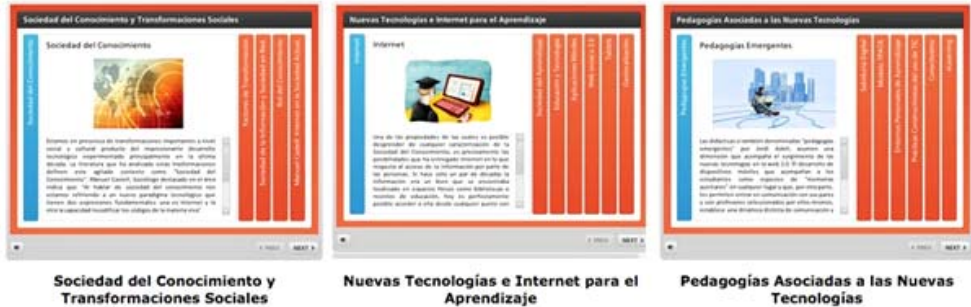
Figura 4. Contenido de módulo (elaboración propia).

El Módulo 2: Sociedad del Conocimiento y las Nuevas Formas de Aprender en la Era Digital propone 3 líneas de contenido, los cuales puede revisar a continuación: