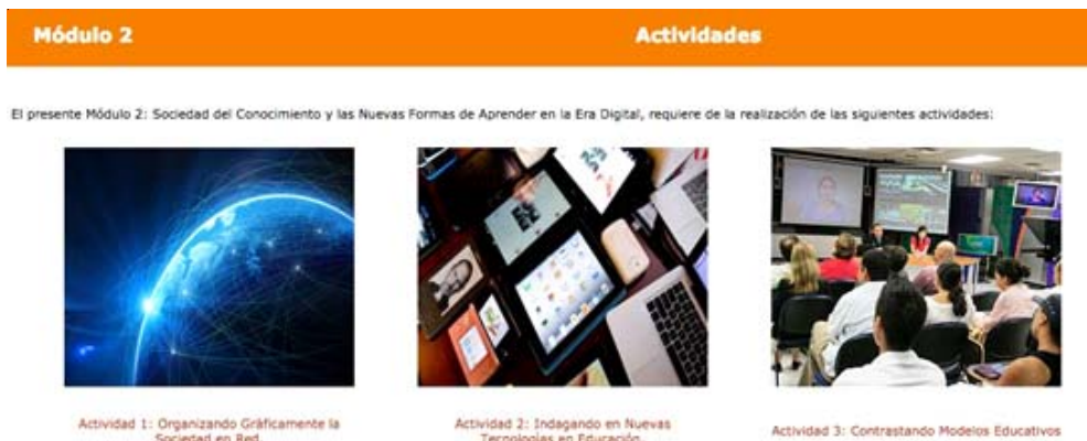
Figura 7. Presentación de las actividades del módulo (elaboración propia).

· Biblioteca: presenta los recursos utilizados en las e-actividades –documentos,