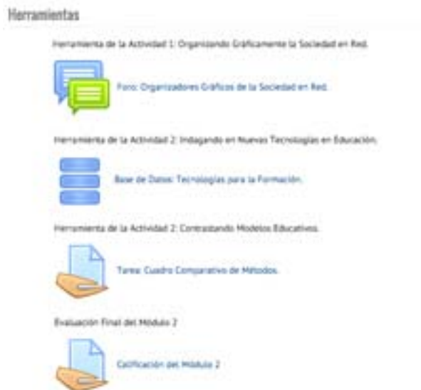
Figura 6. Herramientas del Módulo (elaboración propia)

de autoría del profesor o equipo pedagógico. El contenido es vinculado desde la e-actividad, a través de una instrucción que indica su lectura, revisión y/o análisis. Si se accede en forma independiente al contenido, se encontrará al final el vínculo a las e-actividad asociadas.