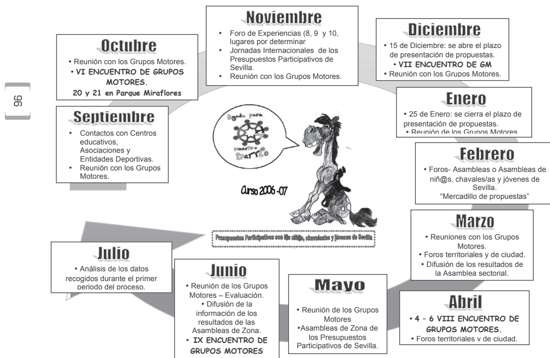
Figura 2. Planificación anual de los Presupuestos Participativos con l@s niñ@s, chavales/as y jóvenes. Fuente: Proyecto de Investigación "Los Presupuestos Participativos con l@s niñ@s, chavales/as y jóvenes de Sevilla 2006/2007" 19 .

El proceso sectorial está organizado en once meses, tiempo durante el cual se trabaja el autorreglamento, las propuestas y se decide qué propuestas deben ser incluidas en el presupuesto municipal, mediante un proceso deliberativo de toma de decisiones.