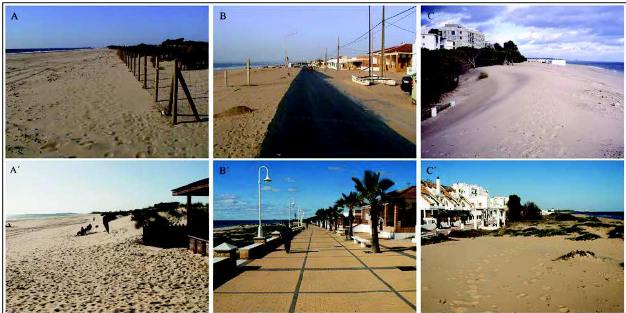
FIGURA 2. Resultados obtenidos entre el pasado (A, B, C) y 2015 (A', B', C'), en diferentes tramos localizados en áreas naturales con dunas protegidas (2001 en la foto A), La Antilla (2001 en la foto B), e Isla Cristina (1986 en la foto C).

El trabajo desarrollado coincide con uno de los propósitos planteados con el desarrollo del SIGLA, tal y como señalaron Ojeda y Cabrera (2006) “esta información tiene un enorme valor documental y, el hecho de estar georreferenciadas, permitirá en el futuro volver a los mismos emplazamientos y tomar de nuevo las fotos con el objeto del realizar un seguimiento de las transformaciones territoriales”.