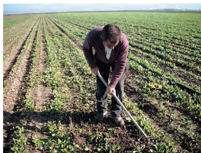
Figura 2. Parcela A.

a) Área de ensayo con tratamiento HS en la línea y tratamiento HNS en la calle (a la derecha de la imagen), y zona de control (a la izquierda de la imagen).