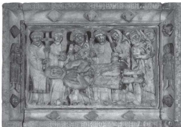
Im. 4