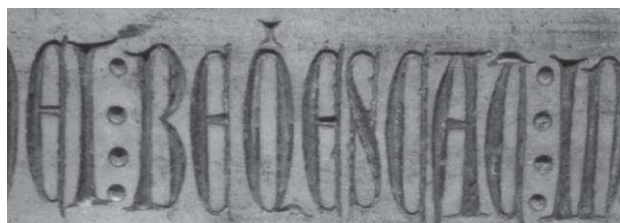
Im. 3 / Foto: Alberto Bolaños Herrera

Los textos B y C, sobre los que nadie había reparado anteriormente, se encuentran pintados con tinta negra, actualmente muy desvaída, en una incipiente minúscula gótica, lo que hace casi impracticable su lectura.