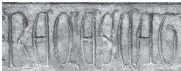
Im. 2

Puede verse en esta inscripción un deseo expreso por parte del lapicida de marcar su carácter métrico, bien interlineando las partes rimadas de la misma –aspecto que trataremos en el comentario filológico–, como separando los versos con barras verticales, especialmente notorio en la franja inferior, donde, mediante este sistema se han separado los vv. 7, 8 y 9, y éstos de la prosa.