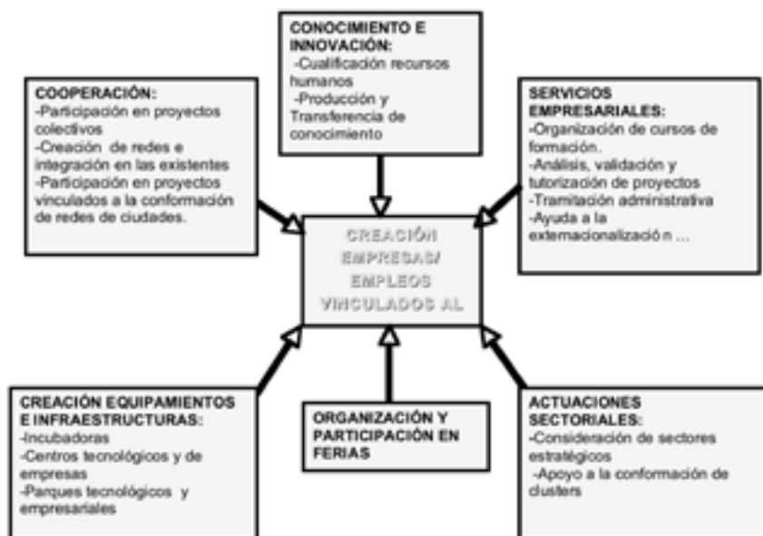
FIGURA 3 ESTRATEGIAS PÚBLICAS PARA LA PROMOCIÓN DE LA ECONOMÍA DEL CONOCIMIENTO EN LA AGLOMERACIÓN METROPOLITANA DE SEVILLA