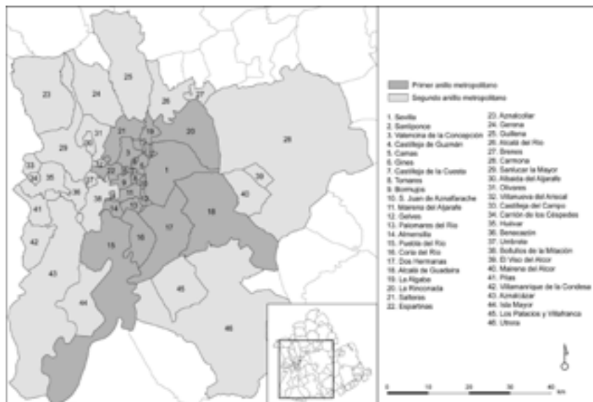
FIGURA 1 MUNICIPIOS QUE CONFORMAN LA AGLOMERACIÓN METROPOLITANA DE SEVILLA