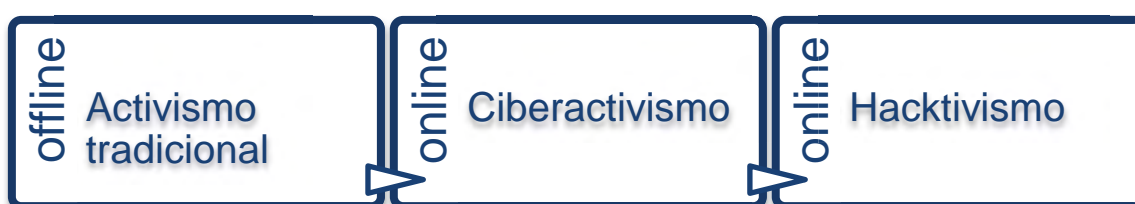
Figura 1. Evolución del activismo offline al online.

secuencia de los pasos a llevar a cabo por los activistas: si en mundo del viejo activismo la organización es previa a la difusión, con el advenimiento de Internet y la web 2.0 se configura un ciberactivismo donde no es necesario construir red para transmitir pues ya viene configurada por el propio contexto online (Ugarte, 2006). Es decir, la organicidad de los procesos sociales colectivos se difunde en una estructura desjerarquizada y autoorganizada. Los movimientos surgidos en la red se basan en estructuras horizontales donde no hay cúpula ni poder jerárquico y todos los miembros tienen un papel igualitario. De acuerdo con Ugarte (2008), en la cibermovilización no hay una dirección consciente ni centralizada, siendo imposible encontrar un organizador ni grupo dinamizador responsable y estable; como mucho, podemos hablar de “propositores” originales que se irán disolviendo poco a poco en el propio movimiento.