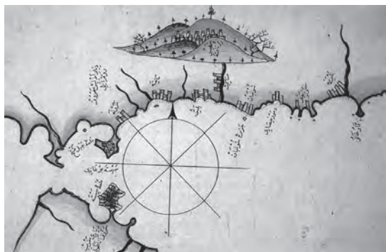
Figura 01. Piri Reis, h. 1517-1528: Litoral mediterráneo andaluz.