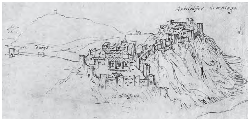
Figura 04. Anton van den Wyngaerde, 1564: Esbozo sobre Gibralfaro.

la coracha aparecen torres inexistentes. Aunque Kagan (1986, 220) indica que pudo ser un apunte del natural, los recintos interiores dibujados a vista de pájaro descartan esa hipótesis.