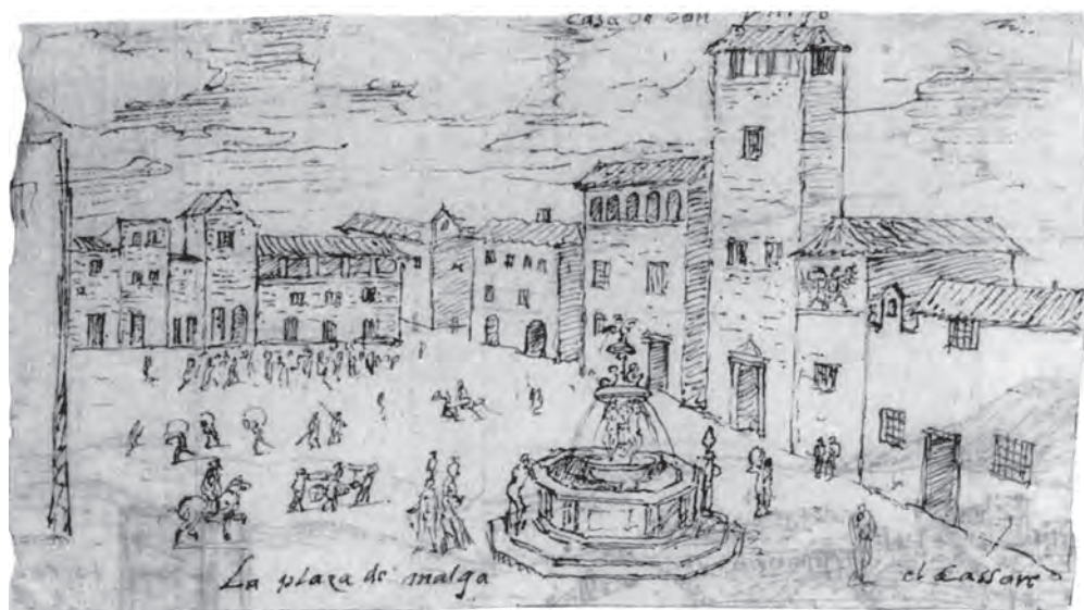
Figura 03. Anton van den Wyngaerde, 1564: Apunte de la hoy llamada plaza de la Constitución (Málaga).

Otro dibujo a tinta (20,5 x 28,5 cm.) conservado en el Victoria Albert Museum de Londres muestra el conjunto fortificado de Gibralfaro. Se trata de un esbozo que guarda escasa correspondencia con la realidad: los perímetros amurallados se han simplificado y en