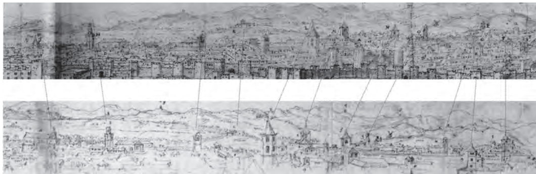
Figura 07. Anton van den Wyngaerde, 1564: Comparación entre fragmentos traspasados a la panorámica final (arriba) desde la vista preparatoria (abajo).