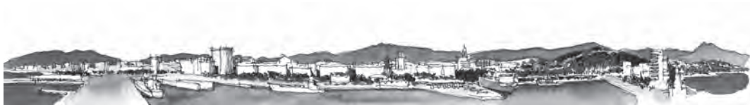
Figura 10. Luis Ruiz Padrón, 2012: Málaga desde posición cercana a la vista final de Wyngaerde.

Se espera que estas imágenes, junto a otras muchas producidas sobre Málaga a lo largo de su fecunda historia gráfica (Ruiz 2016), puedan contribuir a una planificación urbana más eficaz y atenta a la percepción y disfrute de la identidad visual de la ciudad, integrando su pasado y su futuro.