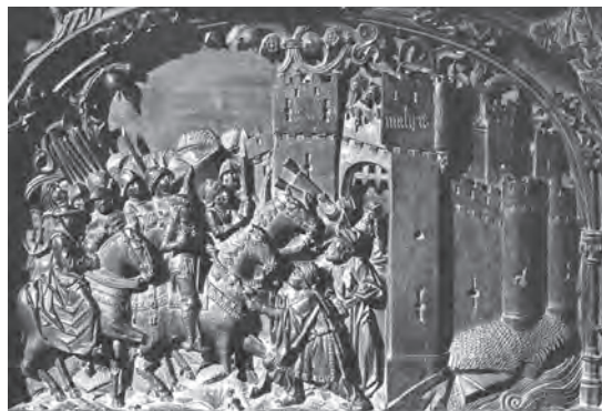
Figura 02. Rodrigo Alemán, h. 1489-95: Relieve en sillería del coro de la catedral de Toledo; la rendición de la ciudad de Málaga.

de Toledo por Rodrigo Alemán entre 1489 y 1495 (Carrizosa 1985), que representan de forma idealizada la conquista de más de 40 poblaciones del Reino de Granada. En Málaga se escenificó la tentativa de asesinato perpetrada contra los Reyes Católicos en las tiendas de campaña usadas al sitiar la población, y en otro relieve, la entrada de tropas cristianas en la ciudad.