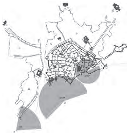
Figura 09. Luis Ruiz Padrón, 2012: Conos de visión y elementos urbanos en las vistas de Wyngaerde y del Civitates, sobre plano esquemático de Málaga en el XVI.

En cuanto al dibujo del Civitates, abarca un cono de visión más reducido pero ofrece una visión realista de la