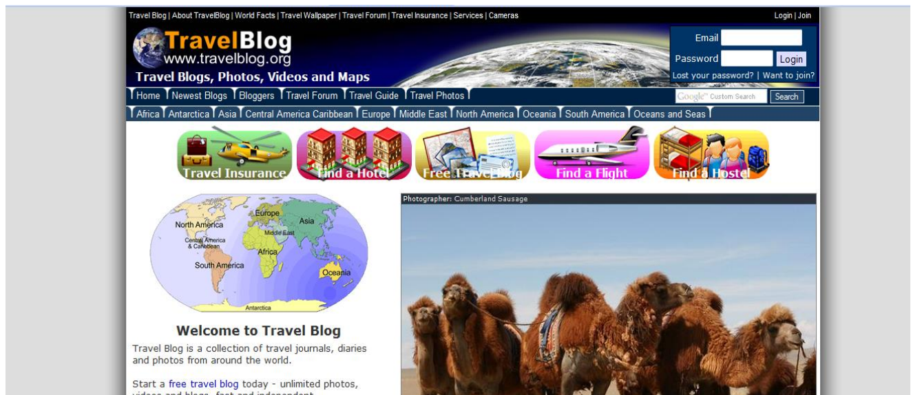
Ilustración 2. Página TravelBlog .

TravelBlog se presenta como una página web que recoge información útil para el viajero independiente. Funciona a nivel internacional, lo que aporta una visión multicultural de los diferentes destinos. El contenido se compone de historias personales que distintos turistas detallan acerca de cómo fue su experiencia. La mayoría de las entradas están acompañadas de fotografías que permiten una visión más enriquecedora y ofrecen al futuro viajero una idea de qué le espera en el lugar de destino. Desde la propia página se puede realizar una búsqueda atendiendo a diferentes criterios, aunque el que destaca por encima de todos es la división por destinos. La web incluye además herramientas comerciales útiles para el viajero como la contratación de un seguro de viajes, la compra de vuelos o la reserva de hoteles. Así como un foro de consultas donde los turistas exponen sus inquietudes ante un inminente viaje o las advertencias para futuros viajeros. Precisamente el carácter global que tiene la página permite al viajero, de un determinado destino, buscar opiniones tanto de compatriotas como de extranjeros.