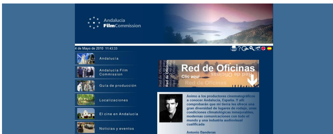
Ilustración 3. Página Andalucía Film Commission .

Andalucía Film Commission es la encargada de proporcionar las coberturas necesarias para la producción de cualquier obra audiovisual en el territorio andaluz. A través de su web tenemos acceso a las diferentes oficinas repartidas por toda Andalucía. Así mismo, desde la página se accede a una completa guía de producción, la cual cuenta con datos relevantes desde el punto de vista logístico, artístico o geográfico. De igual modo cuenta con una base de datos sobre localizaciones en Andalucía, entre las que se puede acceder a los parques naturales, ciudades y pueblos, monumentos, castillos o palacios. Es una web muy útil para la producción cinematográfica andaluza, ya sea realizada en Andalucía o por andaluces. Como valor añadido, los más curiosos pueden consultar los mapas de localizaciones de películas de gran presupuesto filmadas en Andalucía como El camino de los ingleses , Alatriste o El corazón de la tierra , entre otras. Así como una completa guía de enlaces sobre ayudas al audiovisual, instituciones y asociaciones además de un catálogo de los principales festivales andaluces. Es por ello que estamos ante una página de referencia tanto para los productores más especializados como para los realizadores amateurs .