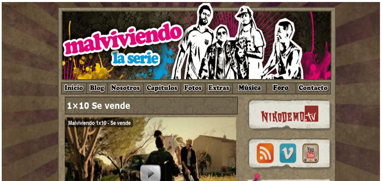
Ilustración 4. Página de la serie on-line Malviviendo

Malviviendo ha demostrado el poder de Internet como alternativa a la ficción televisiva convencional, es un formato realizado sin apenas presupuesto -cuarenta euros en el primer capítulo- desarrollado en un imaginario barrio marginal de la ciudad de Sevilla que cuenta la historia de unos jóvenes muy particulares. Desde un aparcacoches a un camello pasando por un cleptómano que sufre narcolepsia o un exmilitar paralítico que no olvida su paso por el ejército y la cárcel. En su página web se puede visionar la primera temporada completa, -diez capítulos- comprar merchandising u opinar en un foro acerca de los capítulos, los personajes o los estrenos. El apoyo popular que ha acompañado a la serie desde su comienzo hace que cadenas como Telecinco, Canal Sur, La 2 o La Sexta se hayan interesado por la serie. Aunque si bien el éxito del formato se ha consolidado gracias a lo novedoso de su consumo, solo es posible verlo en Internet, lo que además le ha permitido obtener diferentes premios: un oscar otorgado por la EXGAE , el bitácoras 09 del Evento Blog España (EBE) o el premio del público en la edición de 2010 de Best of the Blogs (BOBs).