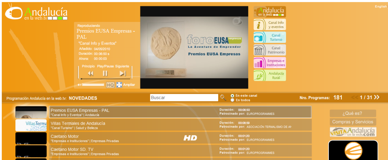
Ilustración 5. Página de Andalucía en la Web.tv .

Andalucía en la web.tv es una propuesta de televisión por Internet de alta calidad, donde se incluyen contenidos muy diversos: desde un canal para eventos, turismo, patrimonio, empresas e instituciones y sin renunciar a la Andalucía rural. Permite tanto una búsqueda en los canales mencionados como una búsqueda personalizada a través de un buscador por los contenidos de la web. Es una página que centraliza gran cantidad de vídeos de no-ficción acerca de la actualidad andaluza por lo que sin duda se convierte en un perfecto escaparate de la realidad andaluza. No solo es útil para turistas andaluces sino también para empresarios, ganaderos, historiadores o incluso antropólogos interesados en la cultura de Andalucía. Dada la enorme cantidad de material y la cuidada selección en la calidad del contenido es una referencia clave tanto para investigadores como aficionados de cualquier tipo por lo andaluz, además de ser un excelente portal para el visionado de vídeos andaluces.