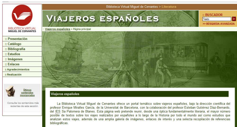
Ilustración 8. Página web Viajeros españoles

Esta es la página web de viajeros españoles, coordinada por la Biblioteca Virtual Miguel de Cervantes, un portal temático que reúne gran cantidad de textos literarios sobre viajes realizados por españoles, además de estudios que los analizan e imágenes y enlaces de interés para el viajero. Es una página que desde una perspectiva interdisciplinar recoge trabajos relevantes ya sea por su interés histórico, literario o investigador. A pesar de que aún permanece en construcción ya es posible consultar en ella gran cantidad de ilustraciones, retratos y mapas de todas épocas y lugares realizados por españoles. Gran parte de estos textos y estudios pueden ser consultados directamente en la base de datos de la Biblioteca Virtual Miguel de Cervantes o son remitidos a los respectivos vínculos que permiten una consulta libre. Una de las grandes aportaciones de esta web, sobre viajeros de todas las épocas, consiste en que todo el material es consultable de manera no restrictiva. Por lo tanto se convierte en una excelente iniciativa que aúna tanto a los amantes de los viajes como a los de la literatura.