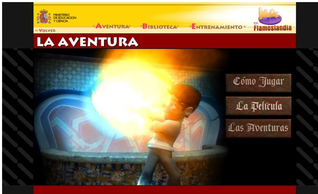
Ilustración 6. Flamoslandia , página del Ministerio de Educación y Ciencia sobre el aprendizaje del flamenco

El Ministerio de Educación y Ciencia crea Flamoslandia , una página web que enseña a los más pequeños a conocer más sobre el flamenco. A través de una completa herramienta didáctica, dividida en tres niveles, presenta tanto una introducción de forma más general como una metódica explicación más pormenorizada de sus detalles. El primero de los niveles es un entrenamiento que permite diferenciar las características básicas del género, donde se establecen divisiones tan precisas como las que distinguen entre esquemas poéticos, rítmicos, melódicos o armónicos. Una vez conocidas las principales peculiaridades del flamenco se puede pasar al segundo nivel, titulado “aventura”, que permite gracias a una narrativa gráfica jugar a descubrir las diferentes variedades del mismo. En un tercer nivel se puede consultar una interesante biblioteca donde tienen cabida tanto diferentes grupos como palos del flamenco. Estamos por lo tanto frente a una web que permite a los más jóvenes aprender a través de una interfaz sencilla y accesible las diferentes variedades y definiciones de una de las representaciones más relacionadas con Andalucía: el flamenco.