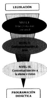
Fig. 2: Niveles de interpretación y concreción curricular.