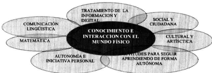
Fig. 4: Margarita de las competencias.

que trabajar el resto (Fig. 4). En este sentido parece dar a entender el currículum oficial, que nuestra materia contribuye a alcanzar todas las competencias teniendo especial incidencia la competencia conocimiento e interacción con el mundo físico (De Pro, 2007). Por lo que la competencia conocimiento e interacción con el mundo físico y natural sería una “macrocompetencia” que tiene una incidencia directa con nuestra área y veremos específicamente para nuestro curso.