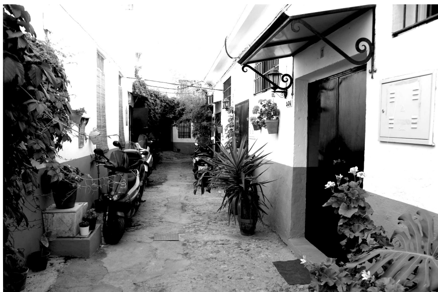
Figura 4. Calle interior del corralón de Goles.