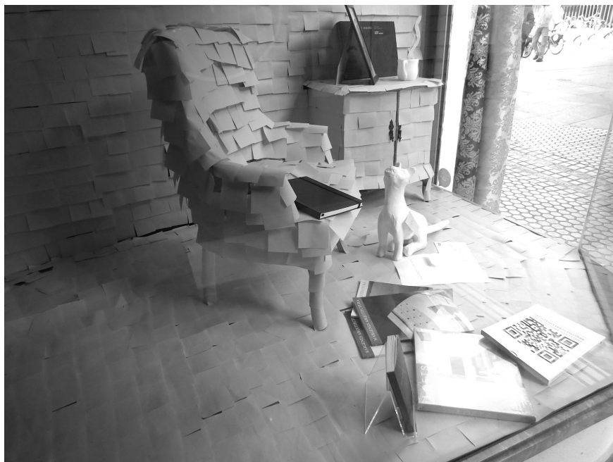
Figura 7. escaparate de la librería Un gato en bicicleta de la calle Regina.