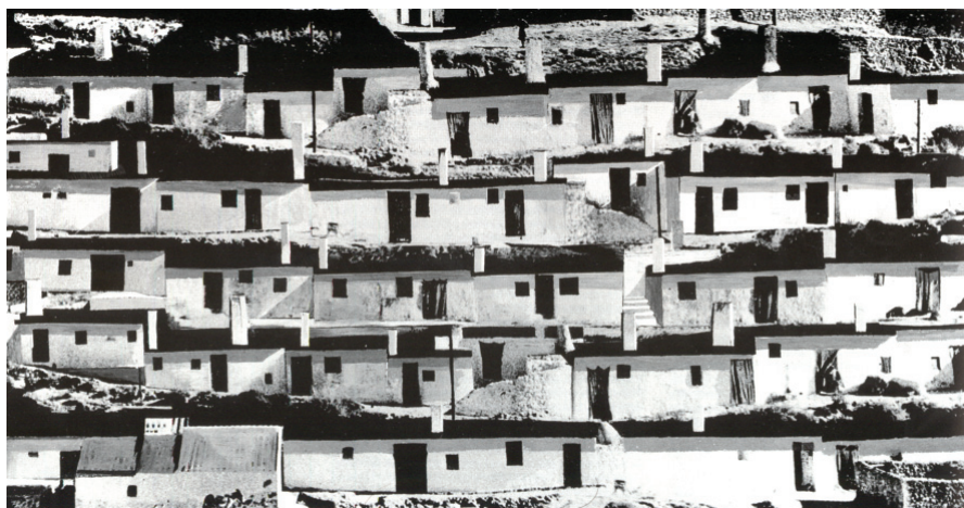
Montaje fotográfico realizado por el arquitecto José Antonio Coderch, en los años sesenta, a partir de algunos ejemplos de arquitectura popular.

para borrar el recuerdo de la persona a la que condenaba y sus rastros, transcurridos los siglos, son interpretados por arqueólogos. El fracaso de la damnatio memoriae se debía más a la resistencia de la memoria colectiva que a problemas de eficacia en su ejecución. Pero de la arquitectura popular no quedan ruinas, ni menos aún ruinas gloriosas, sino un montón de escombros. En vez de llorar lo que perdimos deberíamos valorar lo que tenemos. Se trata de que mantengamos vivas estas edificaciones usándolas. El desconocimiento de los aspectos positivos de estas arquitecturas es uno de los mayores problemas que dificulta la puesta en marcha de medidas concretas que sirvan para conservar y mantener este patrimonio.