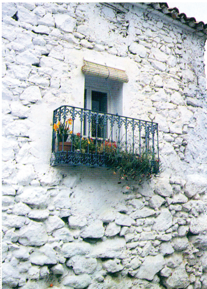
SANTIAGO OJESADA GARCÍA

Las paredes interiores y exteriores de la casa se enjalbegaban con cal en su doble misión: higiénica y de consolidación de las superficies del tapial. La compacidad de la tierra apisonada de los muros no era muy grande y la superficie de las tapias, el