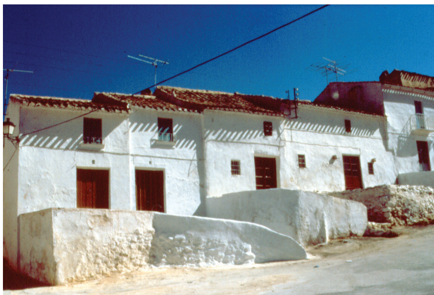
La arquitectura popular tiene sus raíces en su condición preindustrial y su lenta gestación. Estos factores son los que dan esa sensación de permanencia, inmutabilidad e intemporalidad.

Habría que empezar a pensar en la arquitectura popular, no como un amplio patrimonio, sino como un bien escaso que es producto de nuestro pasado. Esas construcciones tradicionales han dejado ya de producirse debido a la desaparición de la economía y cultura que las generó. Las condiciones han cambiado: los profundos cambios habidos en nuestra historia económica y social reciente han dejado, de un año para otro, obsoletas buena parte de las tipologías tradicionales de vivienda; los técnicos y constructores que ahora ejecutan las casas no van a vivir en ellas y sus futuros habitantes tienen unas referen-