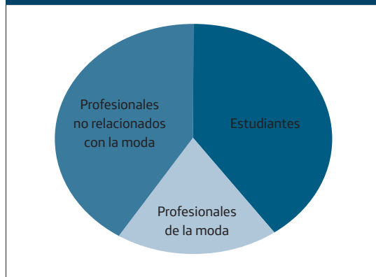
Figura 1. Autoría de los blogs de moda

Teniendo en cuenta este estudio, así como las investigaciones de Encarna Ruiz (2012 y 2013), podemos hablar de la existencia de cuatro tipos de blogs de moda. En primer lugar se sitúan los egoblogs o blogs personales, donde la autora cobra especial protagonismo, presenta sus propuestas estéticas y se las muestra a sus seguidoras. Algunos de estos blogs –la inmensa mayoría en nuestro país– han sido creados por las amantes del shopping o por blogueras con nociones de moda.