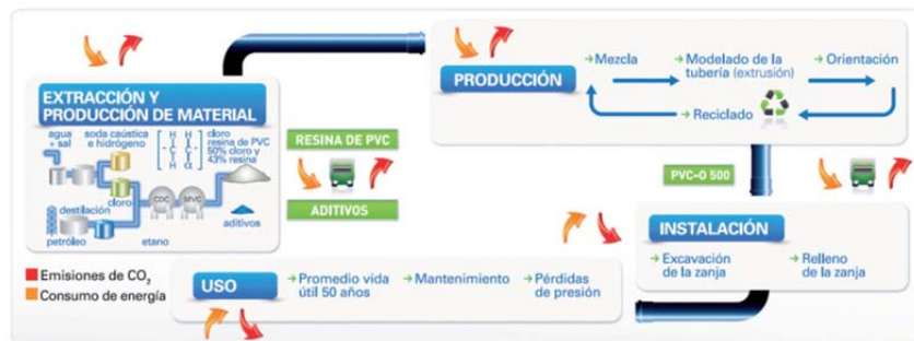
Figura 1. Ciclo de vida de las tuberías de PVC-O

Las Tuberías de PVC-O se presentan como la solución más ecológica debido a su mejor contribución al correcto desarrollo sostenible del planeta, tal como demuestran diferentes estudios a nivel mundial. El PVC-O presenta ventajas medioambientales en todas las fases de su ciclo de vida (figura 1):