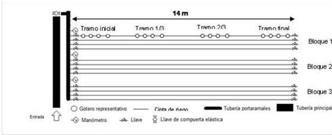
Figura 2. Diseño experimental del ensayo

Se ha empleado agua regenerada procedente de la Comunidad de Regantes Las Cuatro Vegas, concesionaria de las aguas residuales depuradas de la ciudad de Almería.