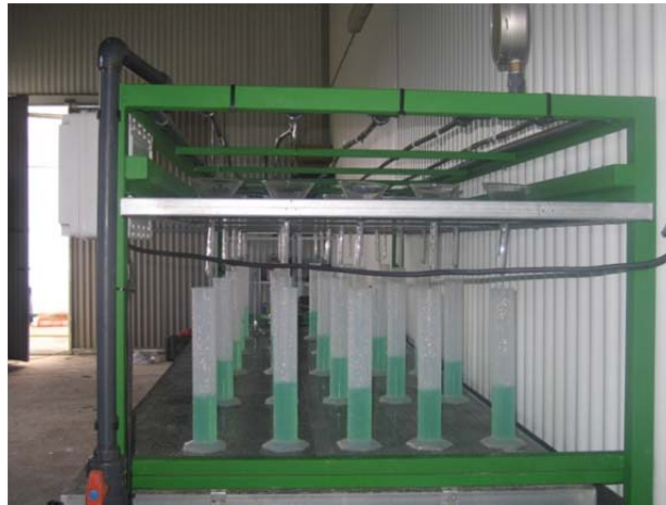
Figura 1. Banco de ensayo diseñado según norma UNE 68-075-86

El banco de ensayo utilizado se diseñó según la norma UNE 68-075-86 (figura 1), evaluando veinticinco emisores por modelo.