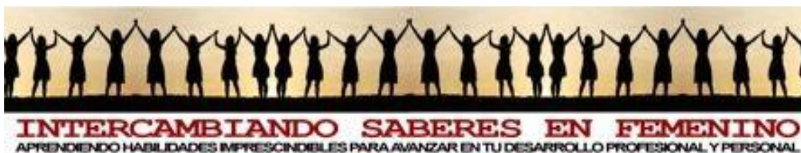
Imagen 1: Fragmento del Cartel anunciador del segundo ciclo de encuentros 1

En su segundo ciclo, de Marzo a Junio de 2014, están programadas doce actividades, ampliándose así las temáticas abordadas, incluyéndose, entre otros, coaching, empleo y mujer; redes sociales: el arte de la comunicación; marketing profesional con mail; contabilidad básica; nociones básicas de ruso; etc. Los temas elegidos vuelven a estar claramente orientados a la mejora de las capacidades de las participantes que actualmente se encuentren en situación de desempleo o que aspiran a una mejora de empleo, o que simplemente optan al aprendizaje.