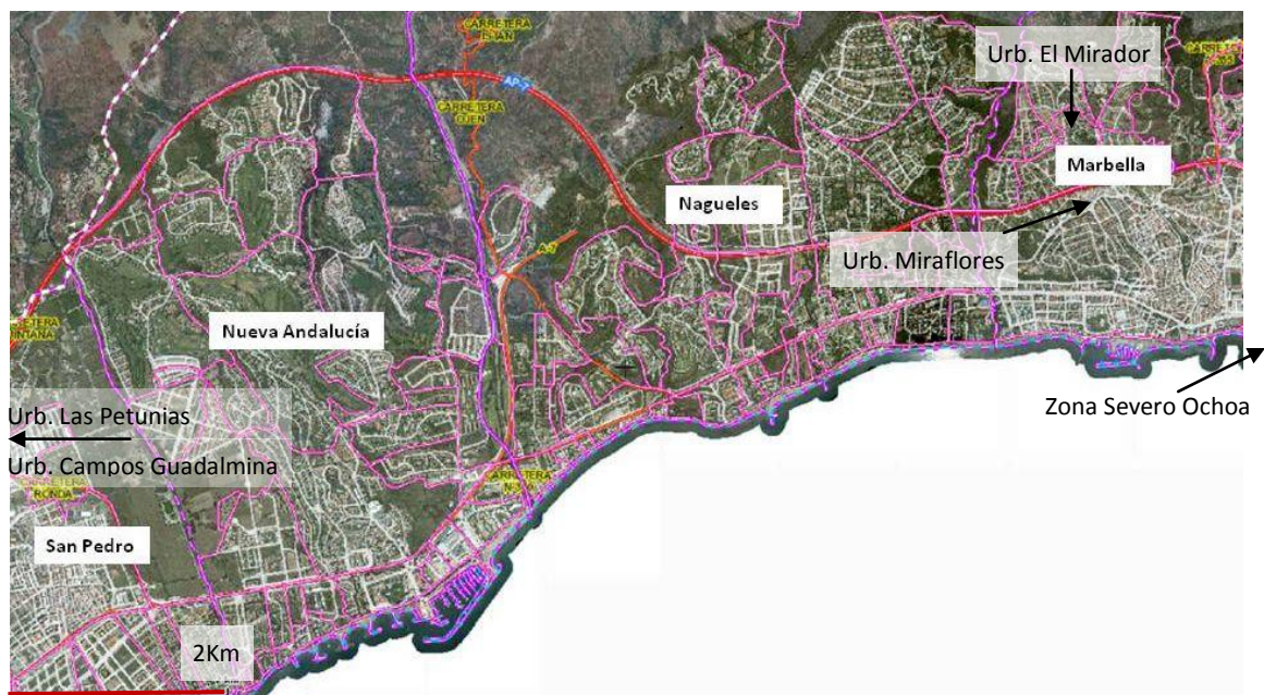
Imagen nº 3. Ortofoto de Marbella, principales núcleos de población.

En este taller intervinieron 11 mujeres residentes en Marbella, en localizaciones diversas: Zona de Severo Ochoa (Hospital Quirón); Zona Miraflores; dos de Urb. residencial alejada del Centro; dos de San Pedro de Alcántara; Centro de Marbella; Urb. Campos de Guadalmina; Urb. el Mirador; Urbanización el Mirador de la Cañada; Urb. las Petunias.