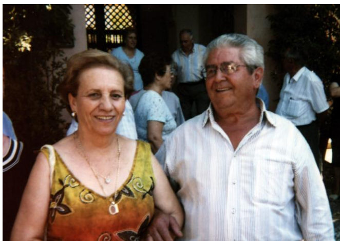
Maruja y Amor

el 29 de julio de muy bien vestida pero me veo tan