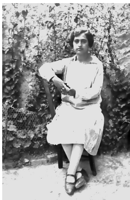
La juventud de Carmen

Conmigo no se metieron pero lo pasé muy mal. Si recuerdo otro caso que sucedió aquí con una mujer: “Había una muchacha que su novio estaba en la guerra y él tenía una moto; durante la guerra ella se quedó embarazada. Cuando se acabó la guerra, él en vez de coger la moto y escapar se vino a la Mancha a ver a su novia. Nada más llegar lo metieron en la cárcel. Él dijo que sabía que iba a morir pero quería casarse para que su hijo tuviera padre. Mira si fueron malos que llamaron a la muchacha y le