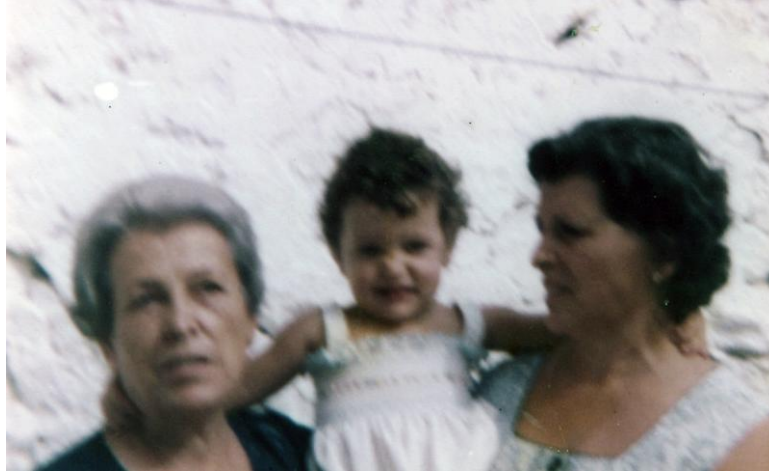
Tres mujeres y una familia

convento vació, el de Santa Clara y allí había mas de ochocientas mujeres. Estuvimos un tiempo, me dieron libertad provisional y a la vuelta ya me llevaron a la prisión provincial. Ya tenía a mi hija. Tuve que llamar a mi marido para que se la llevase de la cárcel a casa; tenía dieciséis meses y se me moría de tan delgadita como estaba y yo también y allí en la cárcel empezó a caminar. Esto era lo que comíamos; las habas duras las cocían y te echaban con un cazo el caldo negro y alguna vez te tocaba un haba o dos; teníamos suerte las que nos mandaban algo. La celadora se quedaba con lo que quería, por lo menos la mitad. Teníamos baldosa y media para dormir, éramos muchísimas. Llegaba el camión y oíamos como se llevaban a quienes iban a fusilar, así un día y otro, también a algunas mujeres”.