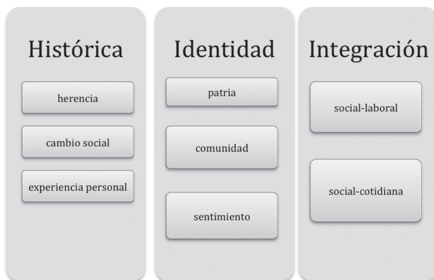
Fig. 3. Las “conciencias” de lengua e identidad en el sujeto emigrante.

1. Conciencia histórica: La percepción lingüística se basa no sólo en el conocimiento formal de la lengua, sino que se construye también a base de sentimientos, imágenes y percepciones retenidas, por ello cabe observar: