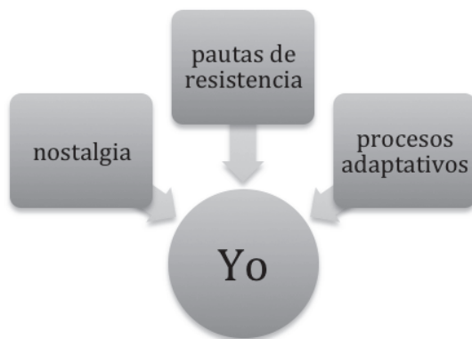
Fig. 3. Reflexión metalingüística del informante.

hacia el modelo patrio y desarrollan pautas de resistencia, centradas en elementos que consideran más apreciados y a los que no están dispuestos a renunciar en virtud de este proceso de adaptación; de otra, tienen presente una proyección de futuro, tanto en el ámbito laboral como en el familiar, es decir, son conscientes de que su inserción laboral y la creación de una familia les lleva a un proceso de convergencia con los usos locales, en este caso, andaluces (Fig. 3). Esto se hace patente cuando tienen hijos y empieza el período de escolarización, ya que los niños adquieren nuevos hábitos lingüísticos, con el consiguiente abandono de lo aprendido de sus padres; en estas circunstancias, muchos individuos manifiestan que se han planteado, incluso de forma consciente, abandonar usos americanos y adoptar definitivamente los andaluces para favorecer la integración de sus hijos.