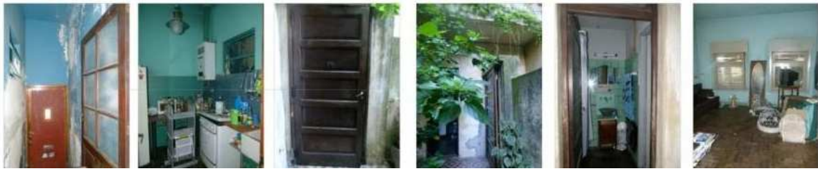
Fig. 2 "Relevamiento fotográfico de la Planta Baja". Fuente: las autoras