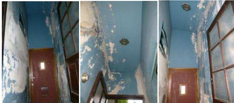
Fig. 3 "Relevamiento fotográfico del Hall de Entrada".