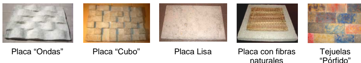
Fig. 5 “Algunos Modelos de Placas para revestir paredes fabricados dentro del Proyecto de Investigación”.

filtración. Pueden usarse como placas para cielorraso y como revestimiento de paredes interiores. Pueden ser aplicadas directamente sobre la pared o bien pueden ser montadas sobre perfiles metálicos o listones de madera, reemplazando el revoque y ahorrando así ese material y mano de obra. Son pintables, serruchables, atornillables y clavables [9b]. Las juntas pueden quedar aparentes y formar parte de la estética del muro, sin necesidad de vendas y masilla para las uniones, las que en placas de yeso se evidencian con frecuencia. Se pueden fabricar con distintos relieves (Fig. 5).