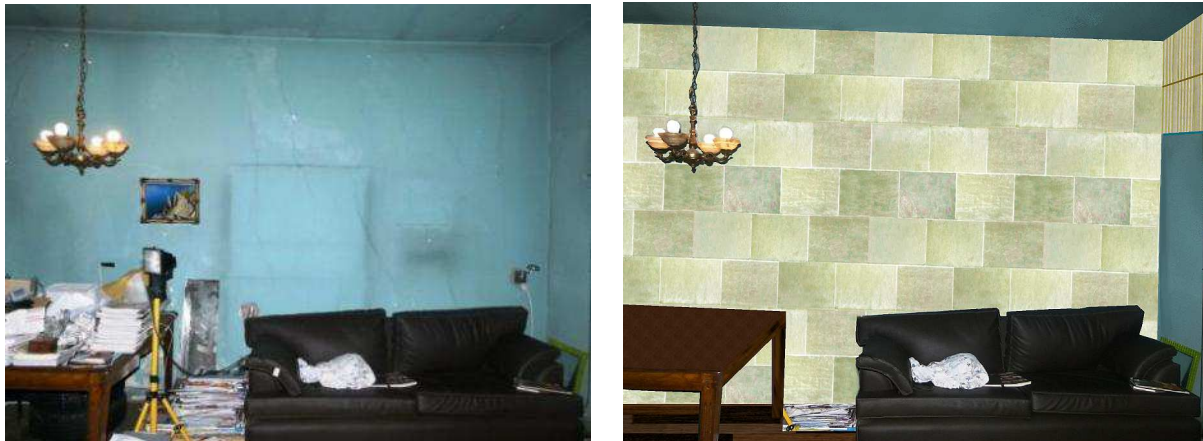
Fig. 7 “Imagen previa a la intervención con rajaduras en pared (izq.) y fotomontaje del diseño de revestimiento de muros (der.)”.

cámara de aire (Fig. 7). Se ocultarán así las rajaduras existentes y se logrará mejor confort higrométrico, térmico y acústico, tema fundamental en una pared medianera.