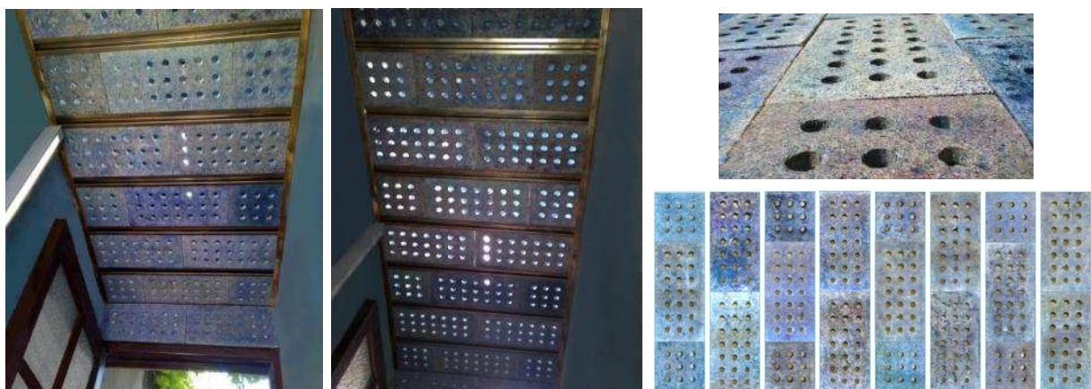
Fig. 4 "Placas utilizadas y Cielorraso del Hall terminado".

A partir de la comparación de productos de mercado, entre ellos el planteado en la tesis del citado Seminario (Superboard) [13d] y aplicando los criterios de los puntos 3.6 y 3.7, se optó por utilizar las placas para cielorrasos y revestimientos de paredes en papel cemento, diseñadas dentro del Proyecto SI de referencia (Ver Tablas 3, 4 y 5). Se descartó el uso de Superboard por su elevado peso unitario, las placas con fibra de vidrio por los desprendimientos de partículas y las de fibra de madera por su alto peso. Por otra parte, en todos los productos que no fueron seleccionados, se necesitaban cortes generando sobrantes y requiriendo más herramientas e insumos. Las placas fueron montadas en media hora por dos personas sobre perfiles omega decorativos, con resultado satisfactorio (Fig. 4). Se evaluarán sus ventajas y posibles inconvenientes a lo largo de dos años a partir de su colocación.