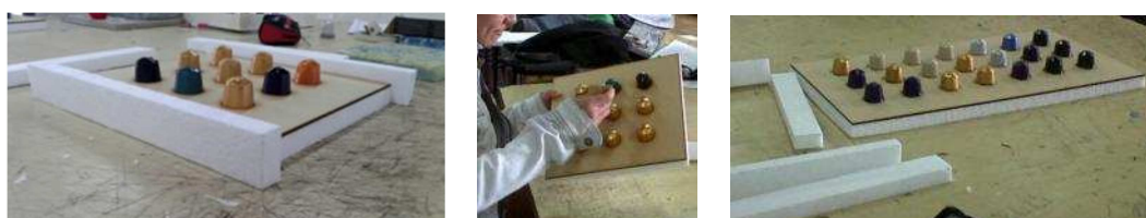
Fig. 6 “Fabricación de moldes con poliestireno y cápsulas de café, ambos reciclados”.

Los moldes que se emplean en esta investigación son de desarrollo propio y están realizados mayormente con residuos de obra tales como poliestireno expandido, maderas, fenólicos y fibrofácil para el cuerpo principal del molde y cápsulas de café, restos de caños o botellas de PET, para lograr las perforaciones en el caso de placas caladas o bloques huecos (Fig. 6).