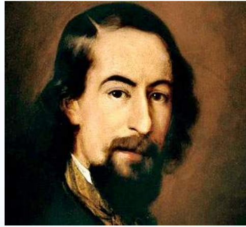
José Zorrilla (1817-1893)