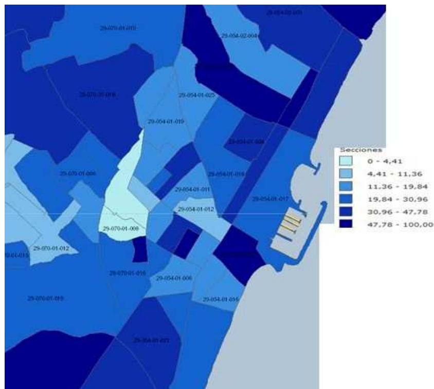
Fig. 2 “Secciones Censales Distritos 1 y 2. Fuengirola. Censo 2011”.

Si examinamos la planimetría que recoge los datos del Censo de 2011, ésta sitúa en el núcleo urbano de Fuengirola las secciones censales con mayor concentración de población inmigrante. Localiza así mismo en los extremos litorales del término municipal otras concentraciones importantes de extranjeros, estimados residentes climáticos puesto que son espacios ocupados mayoritariamente por urbanizaciones de viviendas unifamiliares, algunos identificados por Batista y Natera (2013) por la concentración de británicos.