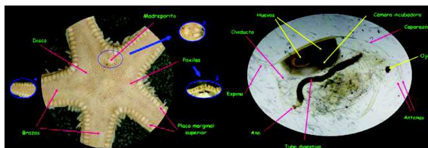
Figura 1. Descripción visual de Astropecten (izquierda) y de un Cladóceros (derecha).

El primer trabajo que nuestro grupo abordó para el tratamiento informático de los ejemplares del laboratorio de prácticas de Zoología, fue un Proyecto de Innovación Educativa publicado en formato CD (Moreno, 2007) y volcado en la página web de la autora ( www.ucm.es/info/tropico ). Los conceptos teóricos imprescindibles para el entendimiento de las imágenes mostradas se presentan como un Guión. Además los términos específicos de la materia se incluyeron en un glosario, que junto con la definición cita la práctica en la que se estudia. Los ejemplares se describen de forma visual por medio de fotografías que comprenden vistas generales, detalles macroscópicos y preparaciones de microscopía (Fig. 1). Las imágenes se presentan por duplicado, rotuladas y sin rotular, de forma que puedan servir a los estudiantes para realizar actividades de autoevaluación y a los profesores para elaborar sus propias presentaciones.