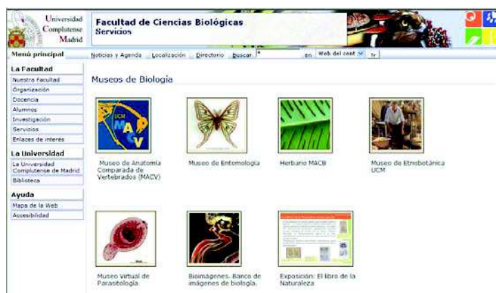
Figura 3. Página de acceso a los Muesos Virtuales de la Facultad de Ciencias Biológicas de la Universidad Complutense de Madrid.

En la actualidad se cuenta con los Museos de Anatomía Comparada de Vertebrados (MACV), de Parasitología, de Entomología y un Herbario Virtual. Es el mejor ejemplo de la extensión de la aplicación de recursos educativos innovadores en materias distintas.