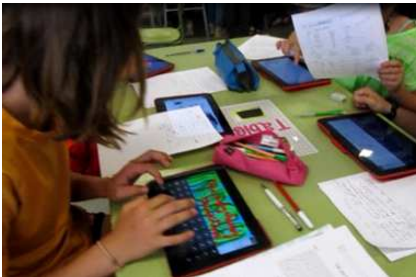
Imagen 1. Alumnado trabajando en el «rincón de la tablet».

d) Clasificación de los indicadores en dimensiones y categorías, en relación a: diseño de la actividad, actuación del alumnado y producciones del alumnado.