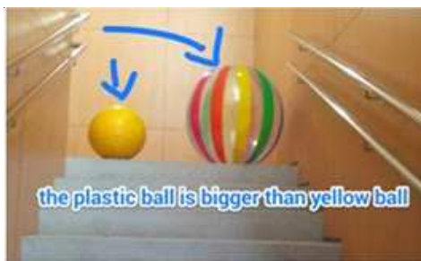
Imagen 2. Producción real de un alumno.

Con la herramienta, obtenemos el análisis que mostramos en la Tabla 2. Algunos de los indicadores tienen asignada una puntuación, entre 1, la mínima, y 5, la máxima. Otros indicadores son de opción múltiple para seleccionar (inteligencias múltiples, competencias, etc.).