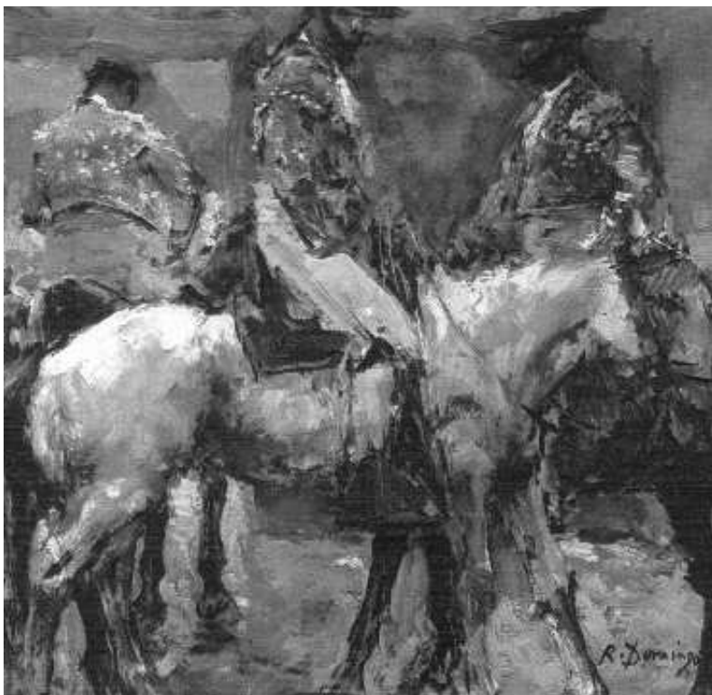
Fig. n.º 50.– La atrevida composición de este cuadro de Roberto Domingo – Antes de la corrida (1911)– recuerda los enfoques de los impresionistas franceses pero el primer plano del caballo y las figuras con cabezas y sombreros cortados son reminiscencias del moderno uso de la fotografía. Técnica mixta, 25´4 x 28 cm, Córdoba, Museo de Bellas Artes (Agustí, 1998: 75).

láceos que evidencian ese triste episodio de la historia napoleónica. La transparencia producida por el uso del gouache en este segundo cuadro contrasta con la pintura empastada del primero. Uno muestra el movimiento violento, el otro la abatida retirada. Interesantes nos parecen las obras dedicadas a la