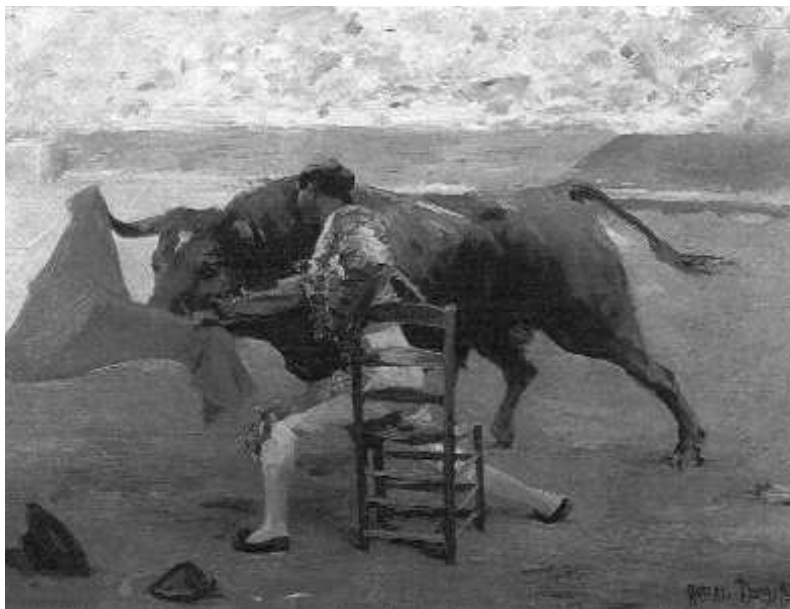
Fig. n.º 48.— Roberto Domingo aun no le da a la luz la intensidad con que aparecerá en obras posteriores. Se aprecia una distinción de planos: el lance del ruedo —tratado con un dibujo más perfilado y detallista— y, en contraposición a éste, los tendidos, compuestos a base de grandes manchas de trazo grueso. En la ilustración Pase de «El Gallo» en un toro que dedicó a María Guerrero. Sevilla, 1913 , ól./tabla, 44 x 60 cm, Col. Jaén (Agustí, 1998: 59).

aún más evidentes. Además de los lances propios de la corrida, el pintor nos muestra escenas relacionadas con el mundo del toro. Son particularmente interesantes aquellas que cap-