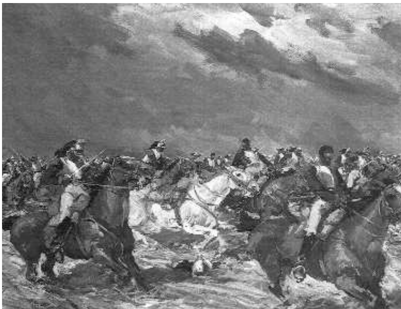
Fig. n.º 51.– El interés por el movimiento están en la base de sus trepidantes pinturas de movimientos militares como son el Dos de mayo de 1808 o la Carga de la artillería . En la imagen una vertiginosa Carga de caballería , gouache, 75 x 105 cm, colección particular (Agustí, 1998: 131).

los caballos, la algarabía y el bullicio contrasta con otros donde le interesa fijar la imagen, como si se tratara de una