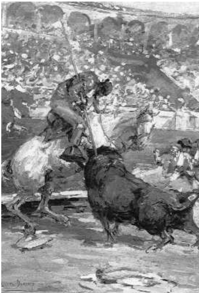
Fig. n.º 49.– Muy diferente al tratamiento de la figura anterior nos parece el aplicado por Roberto Domingo a otros cuadros posteriores como, por ejemplo, –el denominado El primer puyazo , gouache/cartón, 74'7 x 52'6 cm. (Bilbao, Museo de Bellas Artes) (Agustí, 1998: 69)–, en el que el artista ha aclarado su paleta con tonos claros mezclados con colores muy intensos tratados en grandes pinceladas. Obsérvese, de paso, la colocación correcta de la pica en el morrillo del animal.