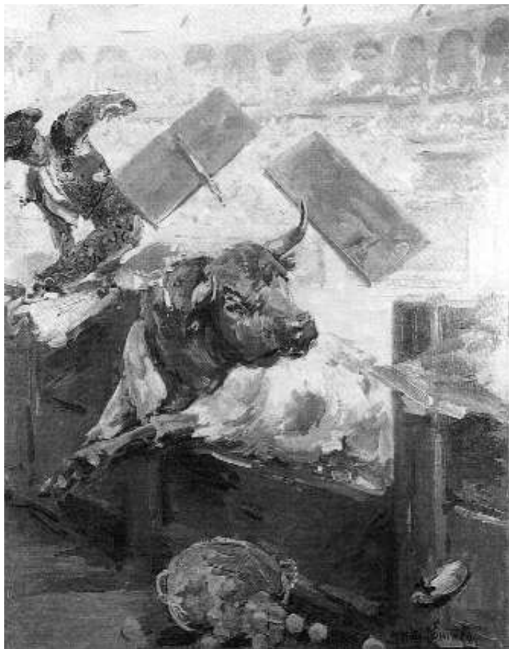
Fig. nº 47.– La cercanía de la residencia en París de Roberto Domingo con la de Toulouse-Lautrec le permitió numerosos encuentros con el artista francés de quien admiró sus vivos carteles y los encuadres descentrados de sus pinturas que no dudó en traer a España por lo que puede considerarse como el introductor de esa nueva sensibilidad artística. Roberto Domingo: Saltando la barrera , boceto para cartel, ól./l., 119 x 80 cm. Colección particular (Agustí, 1998: 49).