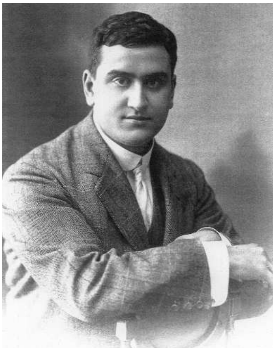
Fig. n.º 46.— Roberto Domingo en su juventud (retrato fotográfico) (Agustí, 1998: 18).

que gozó su padre hizo que la casa de París estuviese siempre llena de artistas, marchantes y clientes que acudían a ella para intercambiar opiniones sobre las vanguardias, comprar