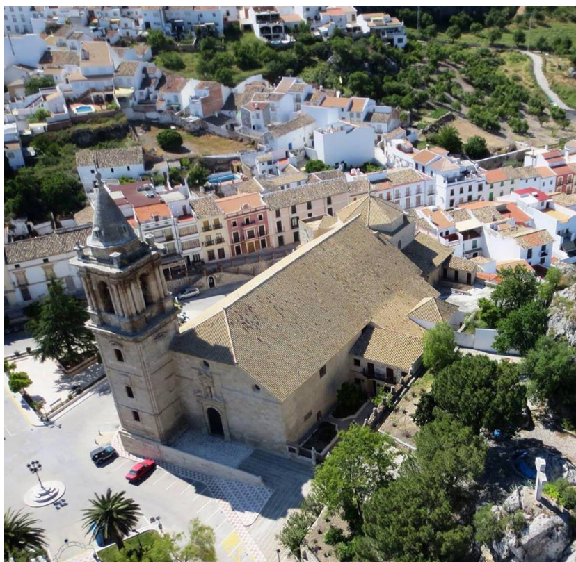
Figura 5. Vista aérea del templo.