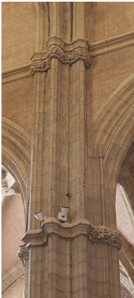
Figura 3. Sta. María de Carmona, 1ª fase, primer y segundo nivel de imposta en los pilares de la nave central.