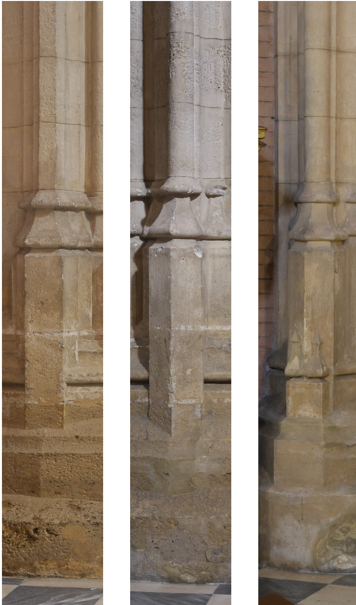
Figura 2. Sta. María de Carmona, 1ª fase, pedestalitos de nervios cruceros en nave central, nave lateral y pilares esquineros.