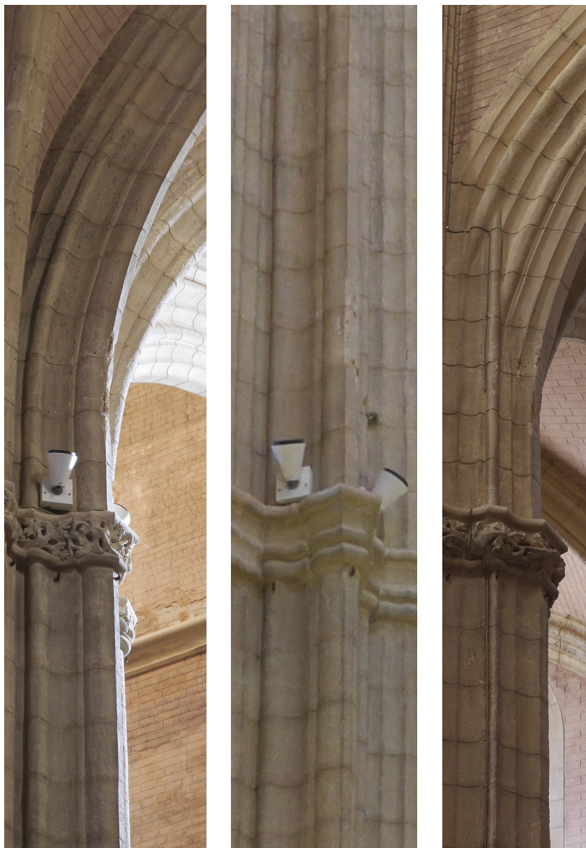
Figura 4. Sta. María de Carmona, 1ª fase, articulación de líneas verticales en el primer nivel de imposta, hacia el perpiaño lateral, hacia la nave central y hacia los formeros longitudinales.