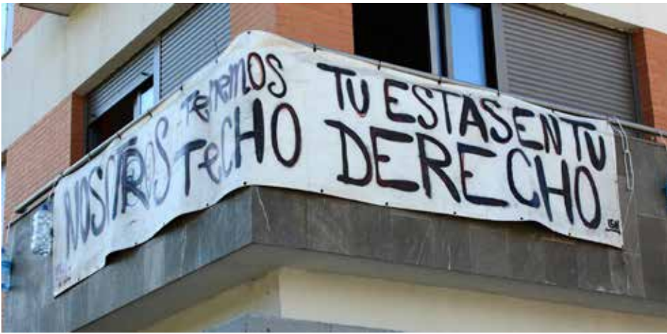
Figura 8. La Corrala Utopía, iniciativa pionera de ocupación en Andalucía.

res, junto a sus redes ciudadanas de apoyo, de ocupar colectivamente un edificio vacío propiedad de una entidad bancaria. Evidenciando las limitaciones de la adjudicación individual de viviendas, este caso abrió una puerta a la innovación política en materia habitacional a través de la construcción de modelos de cogestión basados en las oportunidades de una demanda estructurada (Habitares, 2014), un campo que es preciso explorar en relación con el parque de