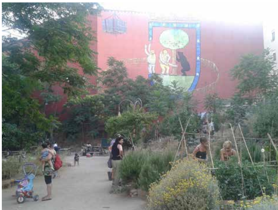
Figura 10. “Esto es una plaza”, en el barrio de Lavapies.

A partir de estas aproximaciones concluiremos sintetizando una serie de orientaciones, a modo de pistas conceptuales y metodológicas, que pueden resultar útiles para avanzar hacia la gestión sostenible de la ciudad y en particular para el tratamiento de las periferias urbanas: