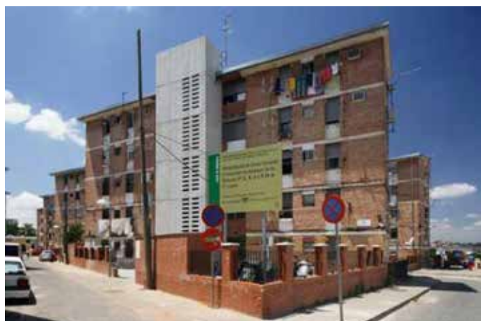
Figura 6. Rehabilitación del barrio San Martín de Porres (Córdoba).

Por último, en un sistema emergente puede haber factores de re-