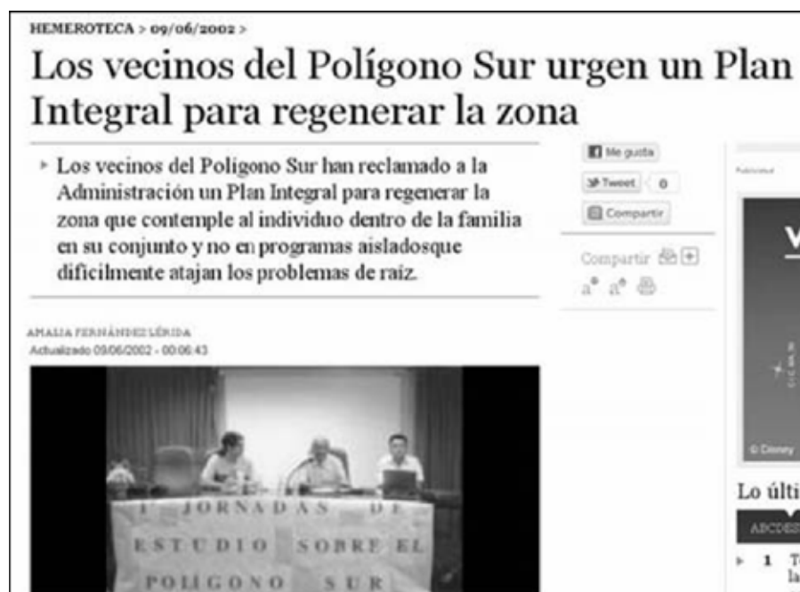
Figura 11. La demanda de nuevos modelos de gestión nace en la periferia social: es la iniciativa vecinal la que desencadenó el proceso que culminaría con el Plan Integral de Polígono Sur.