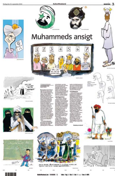
FIGURA 1. Página do jornal dinamarquês Jyllands-Posten , que publicou a série intitulada "Muhammeds ansigt".

O jornal criticava a rejeição muçulmana ao que considera moderno no mundo ocidental, assim como também a exigência destes para que se dê atenção especial a seus sentimentos religiosos, o que segundo o veículo seria “ incompatível com a democracia contemporânea e com a liberdade de expressão, onde um deve estar pronto para aturar insultos zombaria e ridículo ”. Após esta primeira publicação, e o início das represálias, as charges foram republicadas na Noruega, pelo jornal evangélico Magazinet .