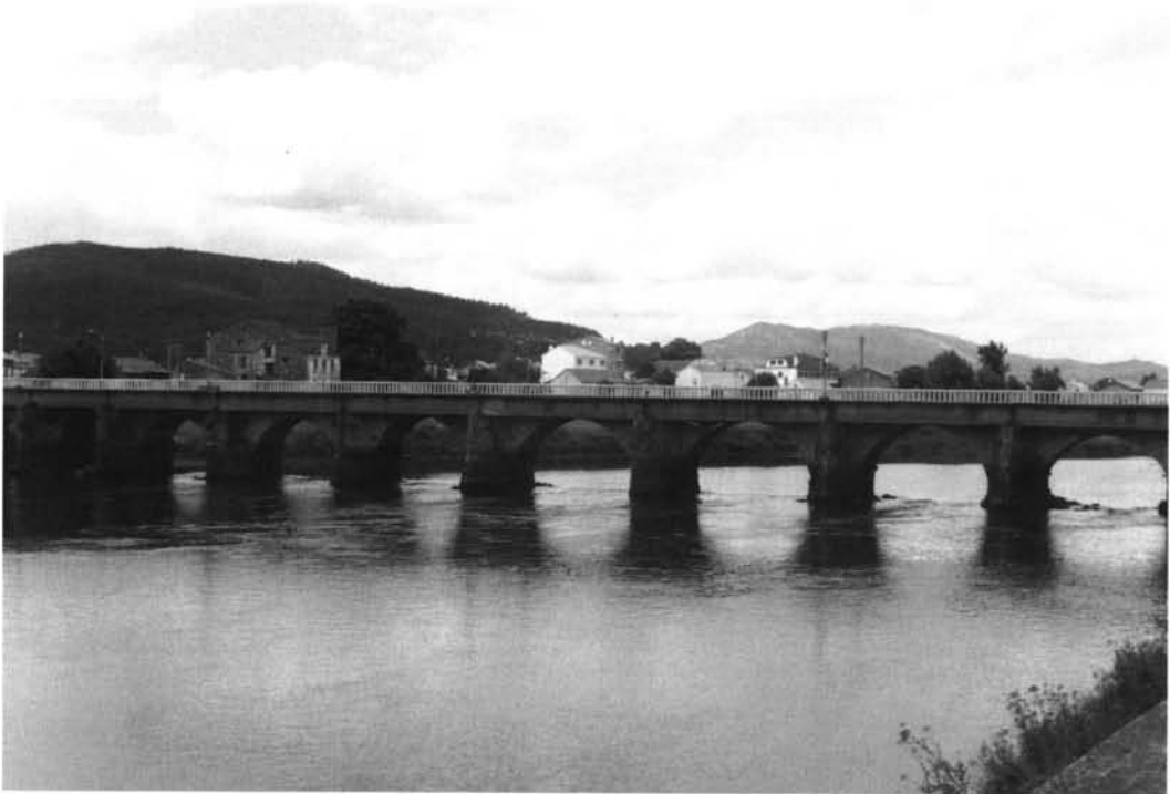
Lámina III. Aquis Celenis - Tria : Puente Cesures.