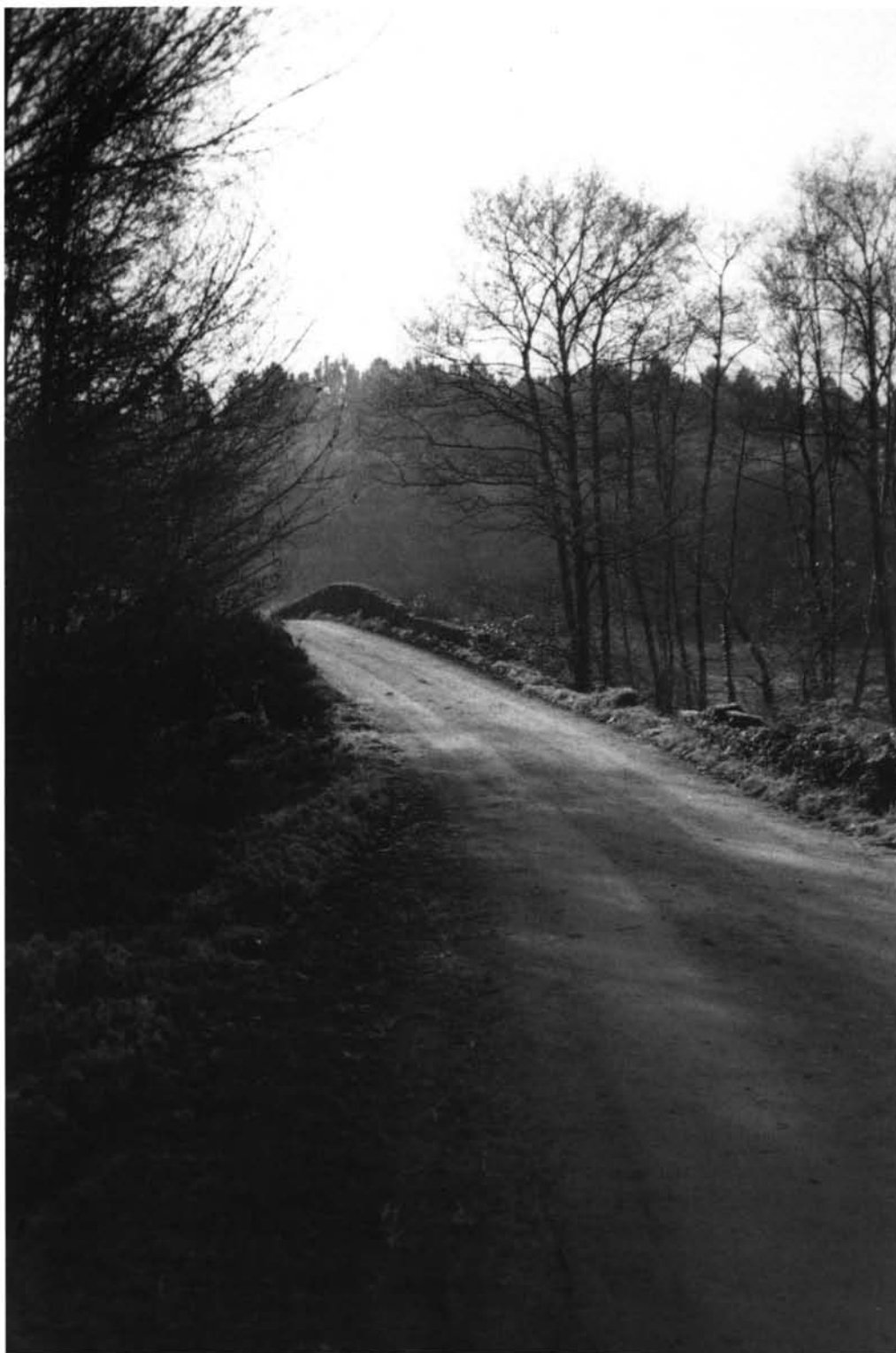
Lámina VI. Luco Augusti - Timalino : Puente Galiñeiros.