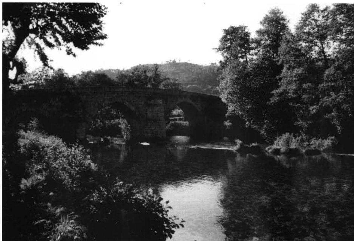
Lámina I. Burbida - Turoqua : Puente de Cernadela. (foto B. Sáez Taboada).