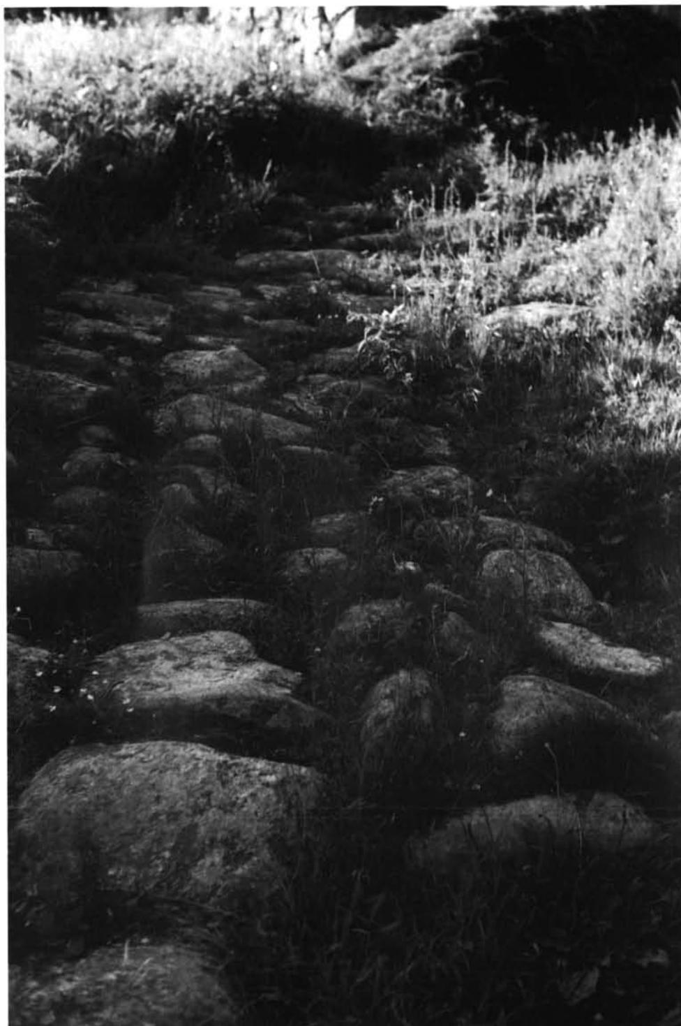
Lámina II. Burbida - Turoqua : Restos de calzada en A Rúa.