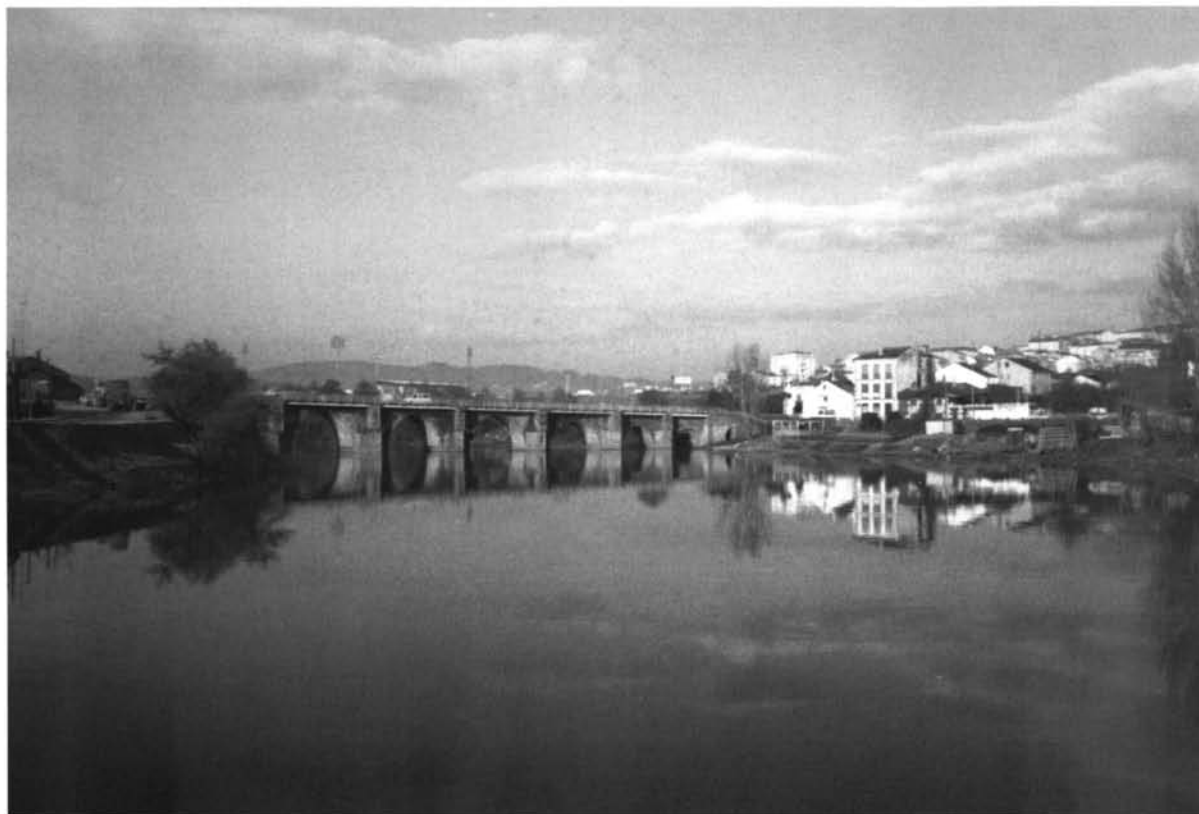
Lámina V. Marcie- Luco Augusti : Puente romano de Lugo.