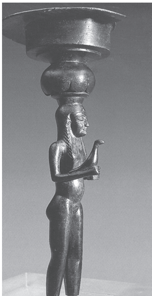
Figura 2. Timiaterio de La Quéjola (Albacete).