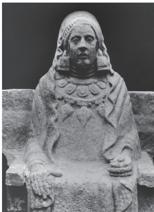
Figura 4. Dama de Baza (Granada).

muestra la importancia otorgada al enterramiento de una mujer (Figura 4). Recientemente, para la tumba de Baza, Rísquez y Hornos (2005) han propuesto que la mujer allí enterrada estaría emparentada con el aristócrata local, cuyos restos son cremados y depositados un tiempo después en la cercana tumba núm. 176, que ordena a partir de ese momento el espacio de la necrópolis. Por esta razón plantean que la mujer de la cámara 155 podría ser la madre del varón de la tumba núm. 176. Otro ejemplo nos lo proporciona el registro del Corral de Saus, en la Contestania valenciana (Izquierdo 2000: 340-341), donde la mayor y más destacada tumba de la necrópolis, junto a la de “las damitas”, “la de las sirenas”, un empedrado tumular de grandes dimensiones que reutiliza elementos monumentales correspondientes a un paisaje anterior 6 , en el que se entierra una pareja de individuos adultos, uno masculino y otro femenino, articula un espacio reducido con enterramientos sencillos alrededor, en hoyo y cista. El área en torno a estas dos grandes tumbas concentra, asimismo, los mayores porcentajes de cerámicas importadas (y sus imitaciones en cerámica ibérica). Otros espacios funerarios, de excavación antigua o reciente, restan por valorar desde estos parámetros espaciales, a partir de un planteamiento de estudio social y de género.