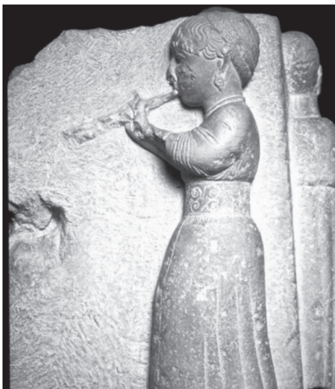
Figura 7. Auletrix de Osuna (Sevilla).

nes: entronizadas, en bustos, placas, estelas y otros monumentos funerarios. Damas y “damitas”, presentes en las tumbas, reflejan la idealización de una sociedad fuertemente jerarquizada.