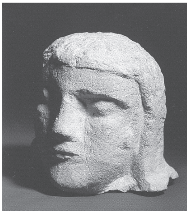
Figura 9. Cabeza femenina de Torreparedones (Castro del Río, Baena, Córdoba), Catálogo Los Iberos, Príncipes de Occidente . 1998, Ministerio de Cultura.