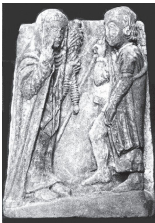
Figura 6. Dama de L’Albufereta (Alicante).