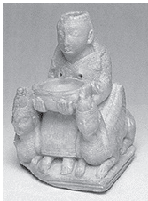
Figura 3. Dama de Tútugi (Galera, Granada).

reconocibles—, o, en otro formato y soporte, la plasmación de ricas figuraciones en cerámicas que a veces constituyen vasos de encargo para ocasiones señaladas. Una cultura mediterránea, con sus características y dinámica propias que diseña, fuera del ámbito doméstico, en las necrópolis y los santuarios, espacios públicos de representación, también femenina.