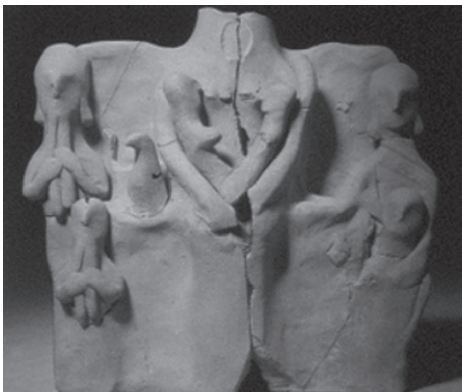
Figura 11. Exvoto en terracota de La Serreta (Alcoy, Alicante)

En este sentido, también señalábamos la posibilidad de que alguna de las representaciones de estos animales que portan los oferentes no fueran aves reales, sino vasos plásticos en forma de palomas, utilizados posiblemente como vasos de libaciones, siguiendo modelos púnicos y cuya presencia tenemos atestiguada en necrópolis y santuarios ibéricos. También los vasos o cuencos entre las figuritas de bronce, con la excepción de un guerrero procedente de Collado (Prados 1996: 138), aparecen asociados al mundo de la mujer, lo mismo que la doble ofrenda que es casi exclusiva de las mujeres. Del mismo modo, hacíamos hincapié en una diferencia esencial entre ambos santuarios, mientras que en el santuario de Despeñaperros el número de exvotos de bronce representaba mayoritariamente figuras masculinas, en Castellar ocurría lo contrario (Prados 1992 y 1997).