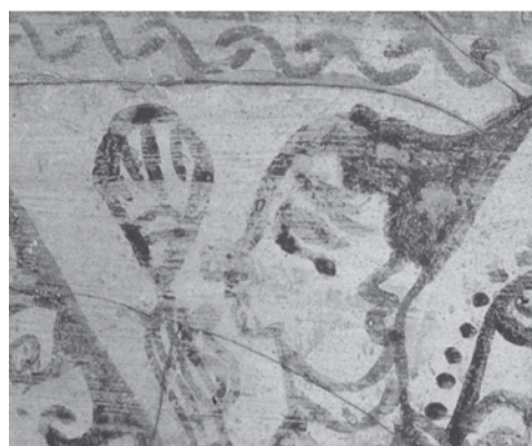
Figura 1. Figura femenina sobre vaso cerámico del Tossal de San Miguel de Liria (Valencia), según Bonet (1995, fig. 145).

de distintos trabajos ( cf. por ejemplo, Alfaro 1999 ó Alfaro y Tirado 2000). También desde el Departamento de Prehistoria y Arqueología de esta misma universidad, se han publicado importantes estudios sobre la imagen femenina en contextos urbanos ibéricos, como el caso edetano (Aranegui 1997b), a partir del estudio exhaustivo de las decoraciones cerámicas de Liria. Este trabajo ha revelado la participación de la dama ibérica de alto rango en escenas de género, en el marco de la ciudad y en el contexto mediterráneo (Figura 1). Sobre esta misma documentación, la decoración figurada en los vasos cerámicos de prestigio, otros trabajos (Bonet e Izquierdo 2000 y 2004) han reflexionado sobre la participación femenina en escenas concretas –de danza y música– en el horizonte del siglo III a mediados del II a.n.e. Por su parte, en el trabajo de Gracia y Munilla (1998), desde la Universidad de Barcelona, se dedica un breve epígrafe al papel de la mujer en el mundo ibérico, donde se plantea la ausencia de directrices de investigación específicas. Los autores consideran la configuración matriarcal de la estructura social de los grupos ibéricos, la idea de la monogamia, las condiciones de vida femeninas, así como el concepto de división sexual del trabajo. Queda apuntada, asimismo, la necesidad de análisis paleoantropológicos de cara a la caracterización del segmento social enterrado en las necrópolis.