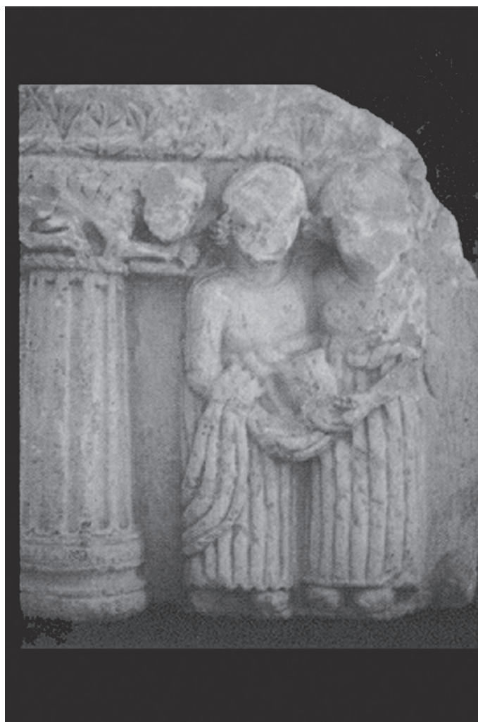
Figura 10. Escena de libación de Torreparedones (Castro del Río, Baena, Córdoba).

Estos rasgos, vinculados a una divinidad relacionada con la fecundidad y con aspectos salutíferos, están muy presentes en muchos de los santuarios del ámbito ibérico. De hecho, las diferencias que se observan entre las ofrendas representadas en los exvotos masculinos y femeninos en varios de los santuarios, pudiera estar relacionado con este mismo aspecto. Hace años una de nosotras ya señaló estas características al hablar de los conocidos santuarios jiennenses de Collado de Los Jardines y Castellar (Prados 1992 y 1996). Del mismo modo, entre las ofrendas hay algunas, como las aves, exclusivas del ámbito femenino. Sin duda, su significado hay que asociarlo, una vez más, al mundo de la fecundidad (se ofrecen aves a Artemis, Afrodita, Tanit y a la divinidad indígena asimilable).