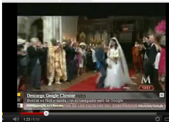
Imagen 3: fotograma de la marca Hot Wheels