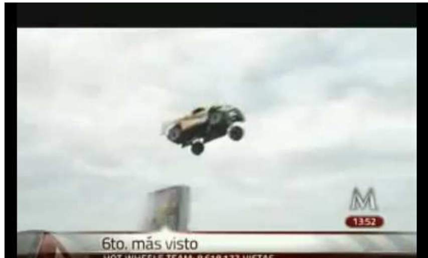
Imagen 2. Fotograma del relato audiovisual