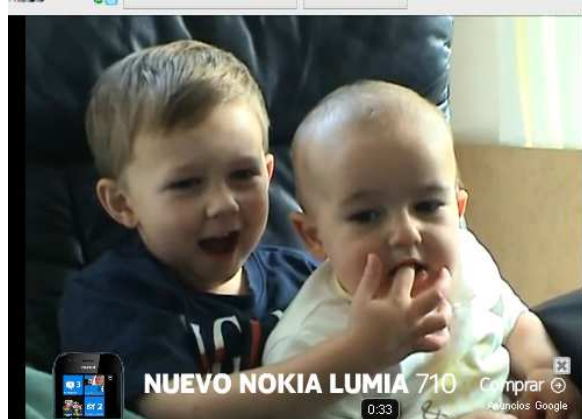
Imagen 5: Fotograma del vídeo