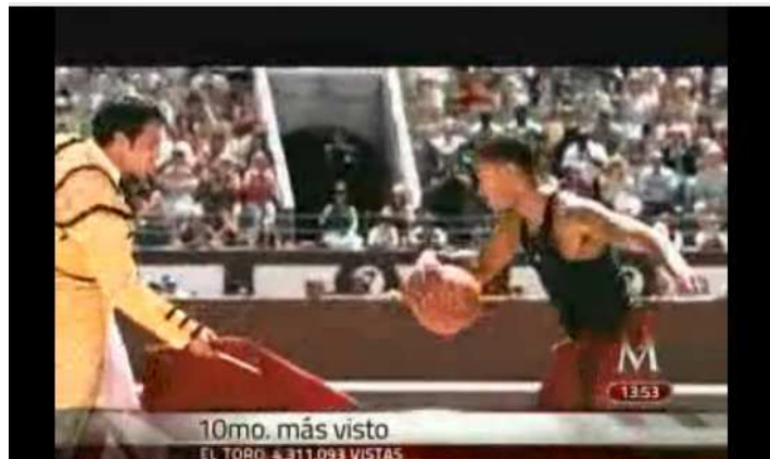
Imagen 4. Fotograma del spot