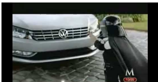
Imagen: 1. Fotograma del spot