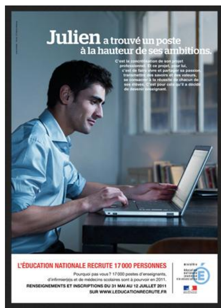
Ilustración 3. Campaña de publicidad del Ministro de Educación Luc Chatel (2011) para reclutar a 17.000 profesores con los eslóganes siguientes: "Laura ha dado con el puesto de sus sueños; Julien encontró un puesto a la altura de sus ambiciones"

Por último, las reescrituras ad infinitum de los decálogos de competencias docentes con la llegada de cada gobierno electo termina dándole a la formación docente, a nivel nacional, un carácter más político que pedagógico o científico a la formación, que no ayuda a profesionalizarse. Más que nunca los referenciales de competencias deberían imponerse desde la cumbre y no a partir de la base, que acusa hoy en muchos de nuestros países europeos los lastres de ambiciones menores para nuestro servicio público.