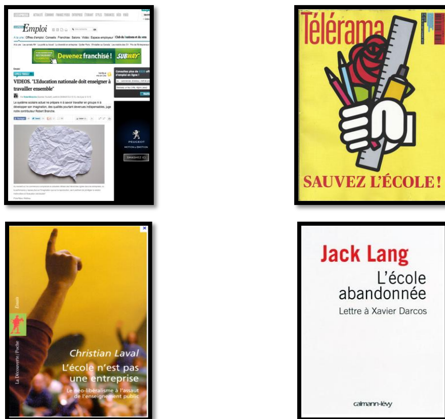
Ilustración 1. Ejemplo de debate mediático, político y/o académico entorno a la escuela en la última década.

mencionarán a continuación algunas soluciones o alternativas pendientes en el contexto de reforma actual, para avanzar juntos en este proyecto tan ambicioso de la formación docente de un espacio geopolítico en el que caben desde 2010, más de 600 000 000 de habitantes. En aquel momento, al menos al 83% de los europeos les importaba poco, algo o mucho, la identidad europea (Commission Europea: 2011, 99). Cabe preguntarse si ese interés ha sido compartido por la hoja de ruta nuestros gobiernos respectivos.