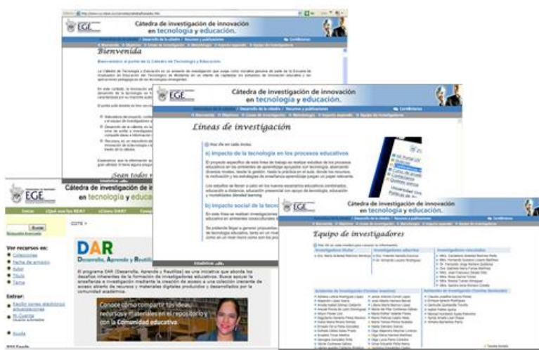
Figura 2. Portal de CIITE ( http://www.ruv.itesm.mx/convenio/catedra )

La característica de este caso es que se parte de una línea de investigación de un profesor titular y se integran otros profesores para formar estudiantes, para trabajar integrados en la temática (simulando un efecto “cascada”), por medio de procesos a distancia.