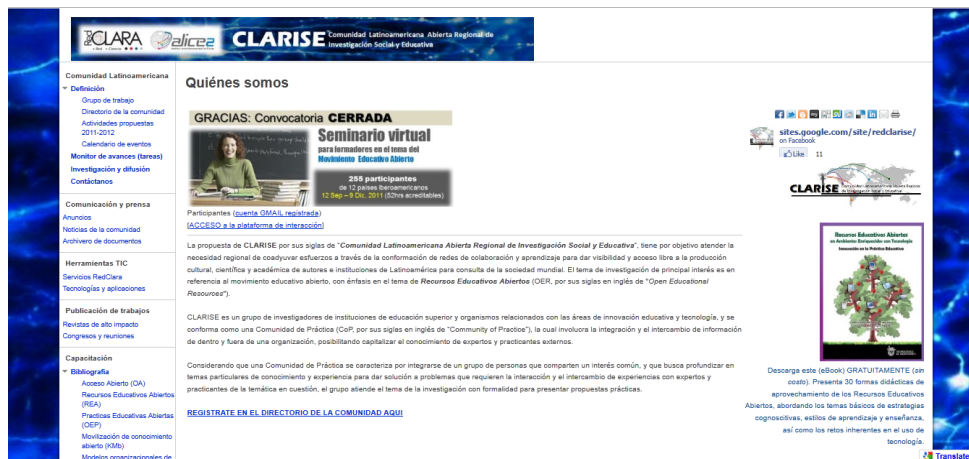
Figura 4. Portal de CLARISE ( https://sites.google.com/site/redclarise/ )

han venido integrando a la red varios participantes de otros países Latinoamericanos, del Caribe y de Europa (ver portal del sitio en Figura 4).