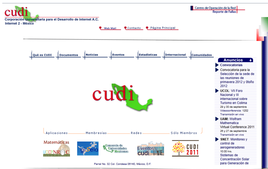
Figura 3. Portal de CUDI ( http://www.cudi.edu.mx/ )

El contexto de este caso se presenta en una red mexicana de investigación educativa: Corporación de Universidades para el Desarrollo de Internet (CUDI http://www.cudi.edu.mx/ ). CUDI fue fundada en 1999 y es una asociación civil sin fines de lucro que gestiona la Red Nacional de Educación e Investigación para promover el desarrollo de nuestro país y aumentar la sinergia entre sus integrantes. En CUDI se busca impulsar el desarrollo de aplicaciones que utilicen la red nacional para fomentar la colaboración en proyectos de investigación y educación entre sus miembros (ver portal del sitio en Figura 3).