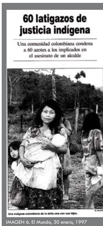
IMAGEN 6. El Mundo, 30 enero, 1997

Ser conscientes de ello nos llevará a tomar en cuenta las representaciones culturales del pasado para ampliar con un nuevo significado a las del futuro. Ampliar de nuevos contenidos las tipologías iconográficas sobre las otras culturas, abrirá múltiples posibilidades de diálogo intercultural y de necesario respeto hacia los ciudadanos de las actuales sociedades de comienzos del s.XIX.