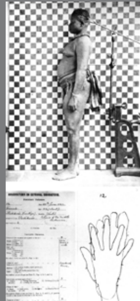
IMAGEN 3. Antropometrías mujer hotentote, 1893.