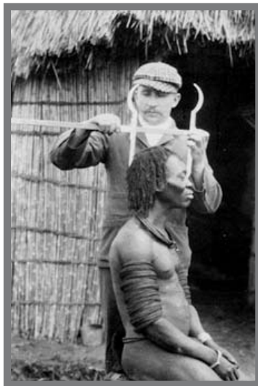
IMAGEN 1. Apuntes antropométricos, 1900

En el presente estudio, centraremos nuestra atención, al igual que Hall, en cómo son leídas estas imágenes, subrayando los sentidos subliminales de éstas, o como diría Barthes, el mito de las imágenes, es decir, los significados ocultos en la construcción de la otredad que siempre son constituidos de manera binaria (nosotros/otros; civilizado/primitivo...). Las imágenes del pasado por tanto, nos ayudarán a entender algunas de las variables iconográficas detectadas en las fotografías y viñetas cómicas de la prensa española actual.