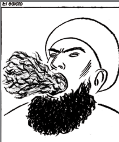
IMAGEN 2. El Roto, El País, 1 octubre 2006