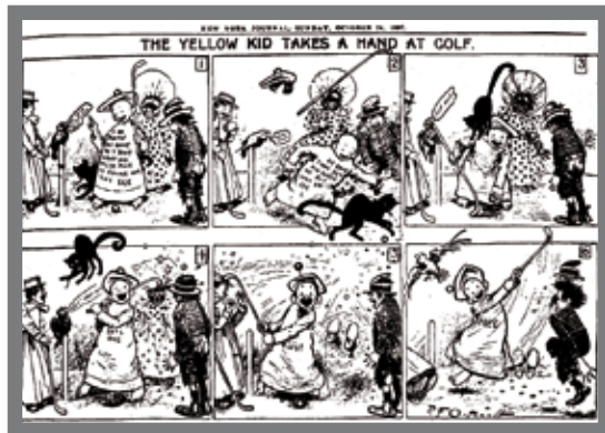
IMAGEN 5. Yellow Kid, Richard Felton, 1895

Como señala Stuart Hall (Hall, 1995:18), el cómic es un artefacto cultural que, como cualquier otro, transmite ideología , esas premisas a través de las cuales proveemos de sentido a las representaciones e interpretaciones de cualquier aspecto de la existencia social. En este sentido, al buscar según Umberto Eco en la obra Apocalípticos e integrados (Eco, 1968) la creación del “personaje”, potencia aquellos rasgos fenotípicos y culturales que más lo describen, ya sea el aventurero, el esclavo, el nativo, o el payaso.