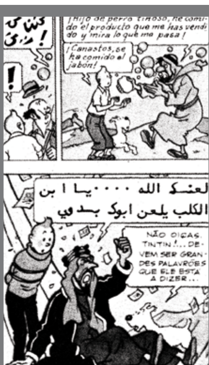
IMAGEN 7. Tintin multilingüe