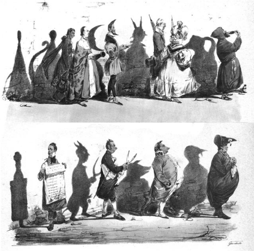
FIGURA 3 y FIGURA 4

J.J. Grandville, "Ombres portées", La Caricature , 11 novembre 1830 et 18 novembre 1830, in L'œuvre graphique complète de J.J. Grandville , t.1, Paris, A. Hubschmid, 1975.