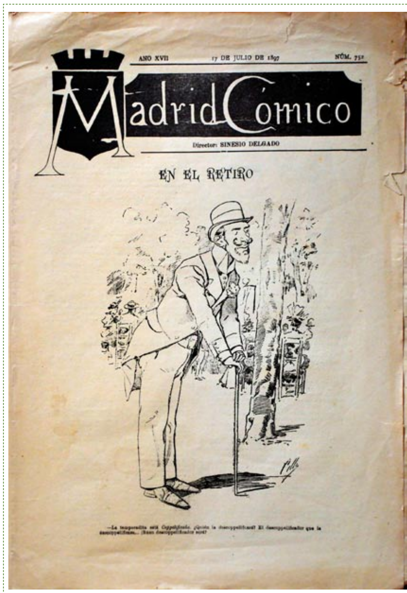
Primera plana de Madrid Cómico , Año XVII, nº 752, 17 de julio de 1897.