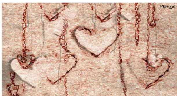
Gráfico 2.1: Portada programa de educación emocional para la prevención de la violencia 2º E.S.O

Como conclusiones de este estudio se ha podido afirmar que el número de situaciones violentas que se vive en las aulas reclama una intervención pedagógica, la resolución de conflictos conlleva una implicación de toda la comunidad educativa y de la sociedad en general, que el motivo por el que surge el maltrato puede combatirse si se