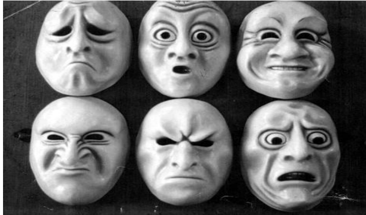
Gráfico 8.4: Rostros-emociones

Después de esto haremos un pequeño resumen, de forma individual, sobre cómo nos hemos sentido representando las emociones y por qué hemos decidido representar una determinada emoción y no otra, esta actividad irá destinada a la clase en conjunto. Y la actividad propuesta para el alumnos encargado de identificar las emociones hará el mismo resumen pero expresando que sentimientos ha experimentado al ver los rostros de sus compañeros.