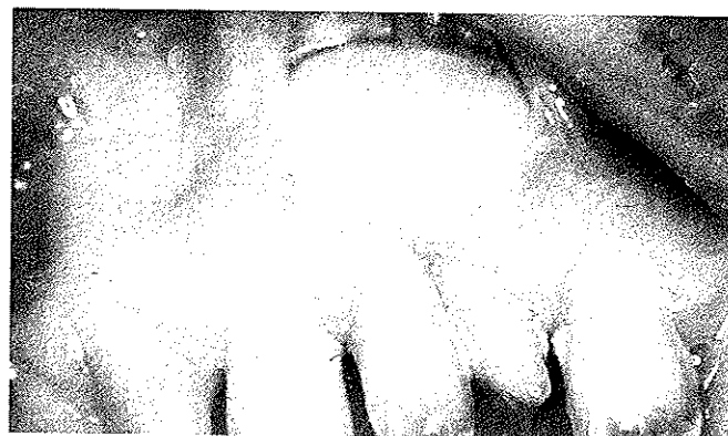
Figura 2. Caso 1, a los 2,5 años de colocado el injerto gingival libre.

Por último, el colgajo se recubre con cemento quirúrgico que será retirado a los 10 días al igual que los puntos. Al paciente se le dan las mismas recomendaciones que en la técnica anterior.