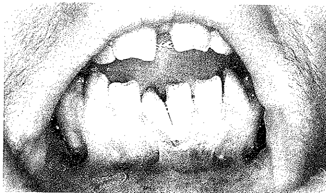
Figura 1: Situación inicial de la paciente del caso 1. Clase II de Miller con un importante componente anatómico de malposición dentaria.