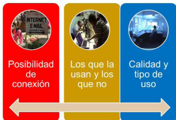
Fig. nº 1. Continuum de significación de la brecha digital. En cierta medida, podríamos decir que más que hablar únicamente de una brecha digital tecnológica, deberíamos hablar de brecha digital socio-cognitiva, refiriéndonos con ella al utilizar las herramientas de Internet para hacer cosas claramente diferentes. No referida por tanto al uso o no uso, sino a los usos diferentes de las tecnologías que pueden hacer las personas.

mente pasando, de los momentos iniciales, donde todo el énfasis se ponían en el acceso, a teniendo el acceso a las TIC, tener la competencia digital y la formación suficiente para saberlas utilizar, y saberlas utilizar de forma novedosa e innovadora (fig. nº 1).